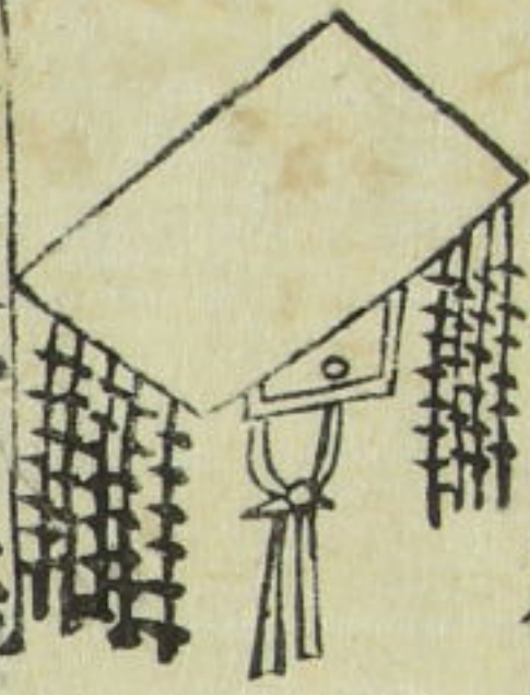
天子ノ旒ハ十二、三公ハ九旒。

冕旒ノ圖 冕ハカフ、リト讀、頭ニ戴ク冠ナリ。木ニテ廣ハ八尺、長一尺六寸ニ造リテ。上ニ龍ヲ、衣上ヲ如ク下ヲ龍ニス。旒ハ冕ノ前後ニ懸ル玉也。璽珞ト云ニ似タリ。