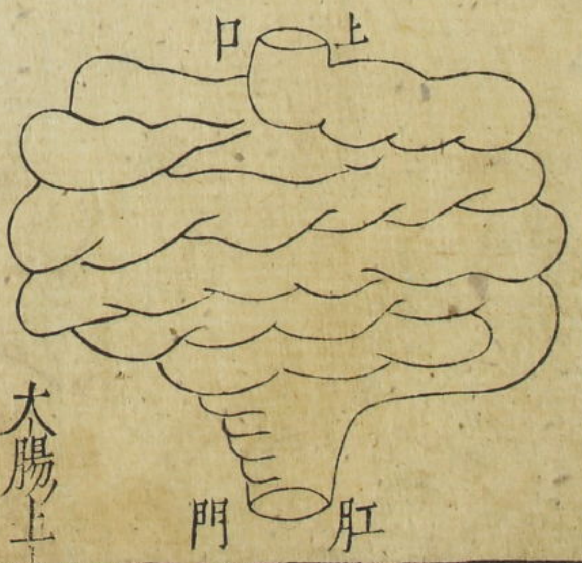
大腸上 口即小 腸下口

大腸者傳道之官。變化出焉。○廻腸當臍左廻十六曲。大四寸。徑一寸寸之少半。長二丈一尺。受穀一斗。水七升半。○廣腸傳春以受廻腸乃出津穢之路。大八寸。徑二寸寸之大半。長二尺八寸。受穀九升三合八分合之一。○是經多氣多血。○難經曰。大腸重二斤十二兩。肝門重十二兩。○按廻腸者以其廻疊也。廣腸者即廻腸之更大者。直腸者又廣腸之末節也。下連肝門是為穀道後陰。一名魄門。總皆大腸也。