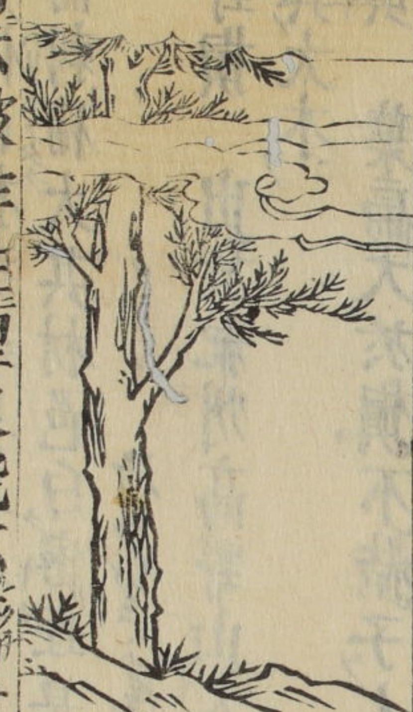
檉 俗稱 臭檉 俗 和名末木 俗云久佐末木 別有真檉故多 臭檉別之

玉篇云檉作柱埋之能不腐者也 △檉爾雅注云檉即杉別名也則是亦杉之屬乎然柏檜 之類也嶺州南部津輕松前多出之其樹皮狀與檜同 剥皮用置屋或絢繩以止槽漏脫之功無異于檜葉亦 似檜而肥厚畧枚不結實其木甚大有高十余丈者用 作概檣稠堅勝於杉又長五六尺許伐斫名檉木檉木 送之大坂檉木則新版覆屋勝于檉也檉木則作榻檉 皆耐水濕良材也又長二三間方五六寸者宜作屋柱