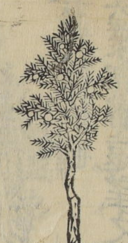
伽羅木 俗稱 伽羅木 於豆古 檉

△檉伽羅木出於嶺東及松前土人呼曰於豆古今京師 亦希有之高五七尺樹葉並類檜相而甚繁茂不見其 枝榿結實圓青色至秋紅熟如櫻桃人取食之味