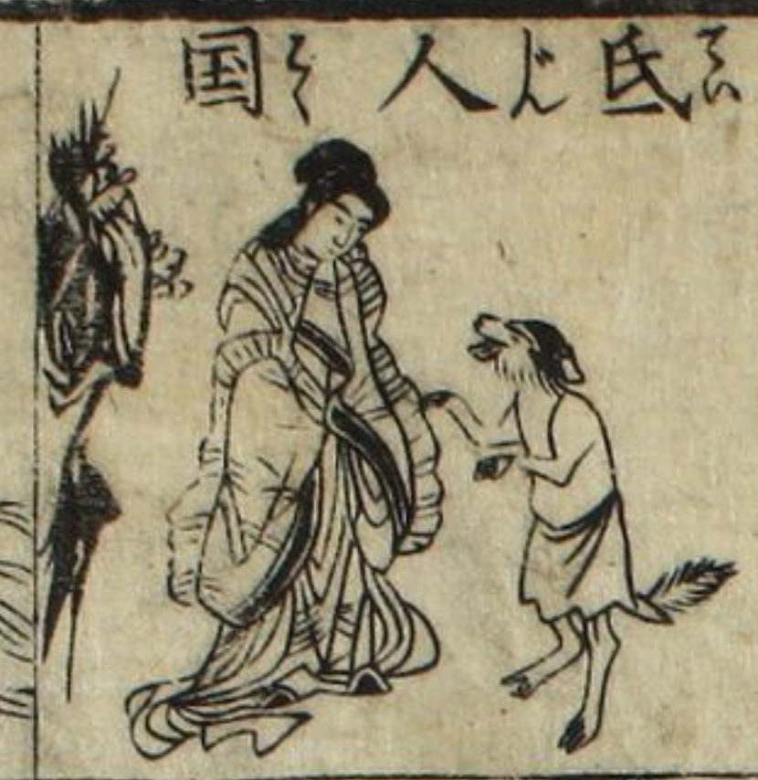
氏 人 國