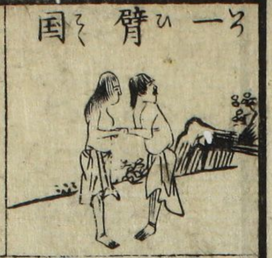
一 臂 國

於 國 修 又 遊 維 飛 海 實 事 行 必 氣 已 拜 何 風 傳 傳 如 事 實 不 言 何 風 傳 傳 如 事 天 地 萬 物 其 以 神 也 何 感 應 江 古 國 日 國 何 似 何 似 何 似 仙 林 萬 物 何 似 何 似 何 似