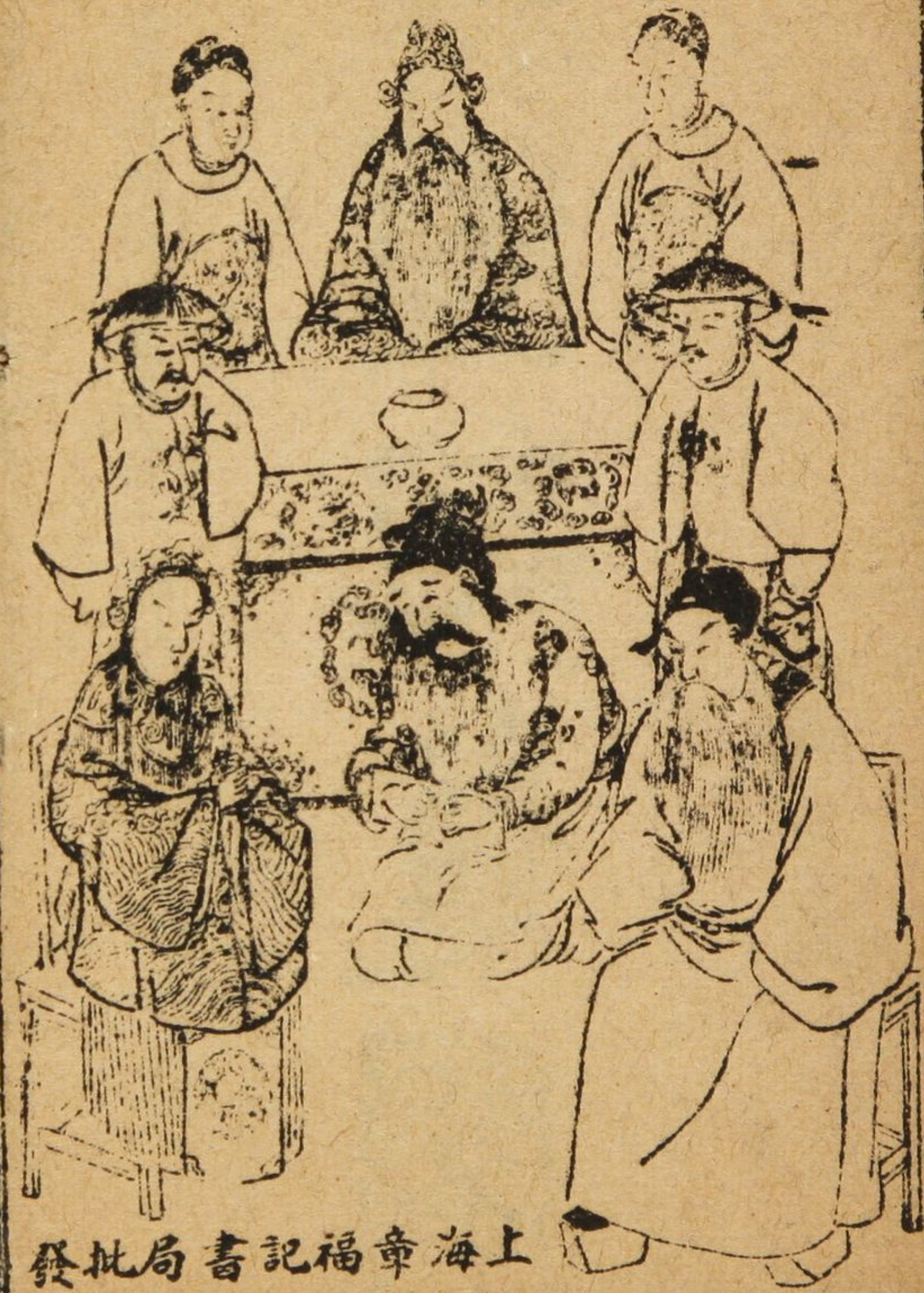
上海章福記書局批發