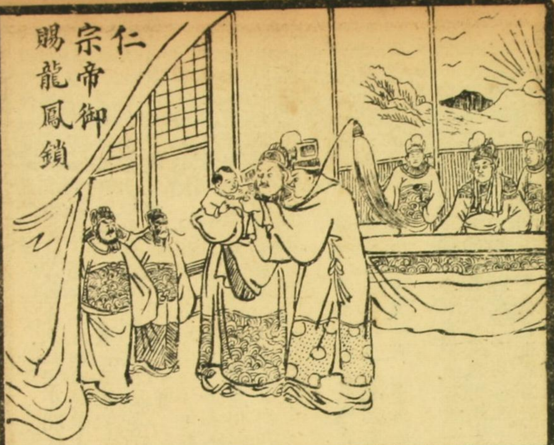
仁宗帝御賜龍鳳鎖