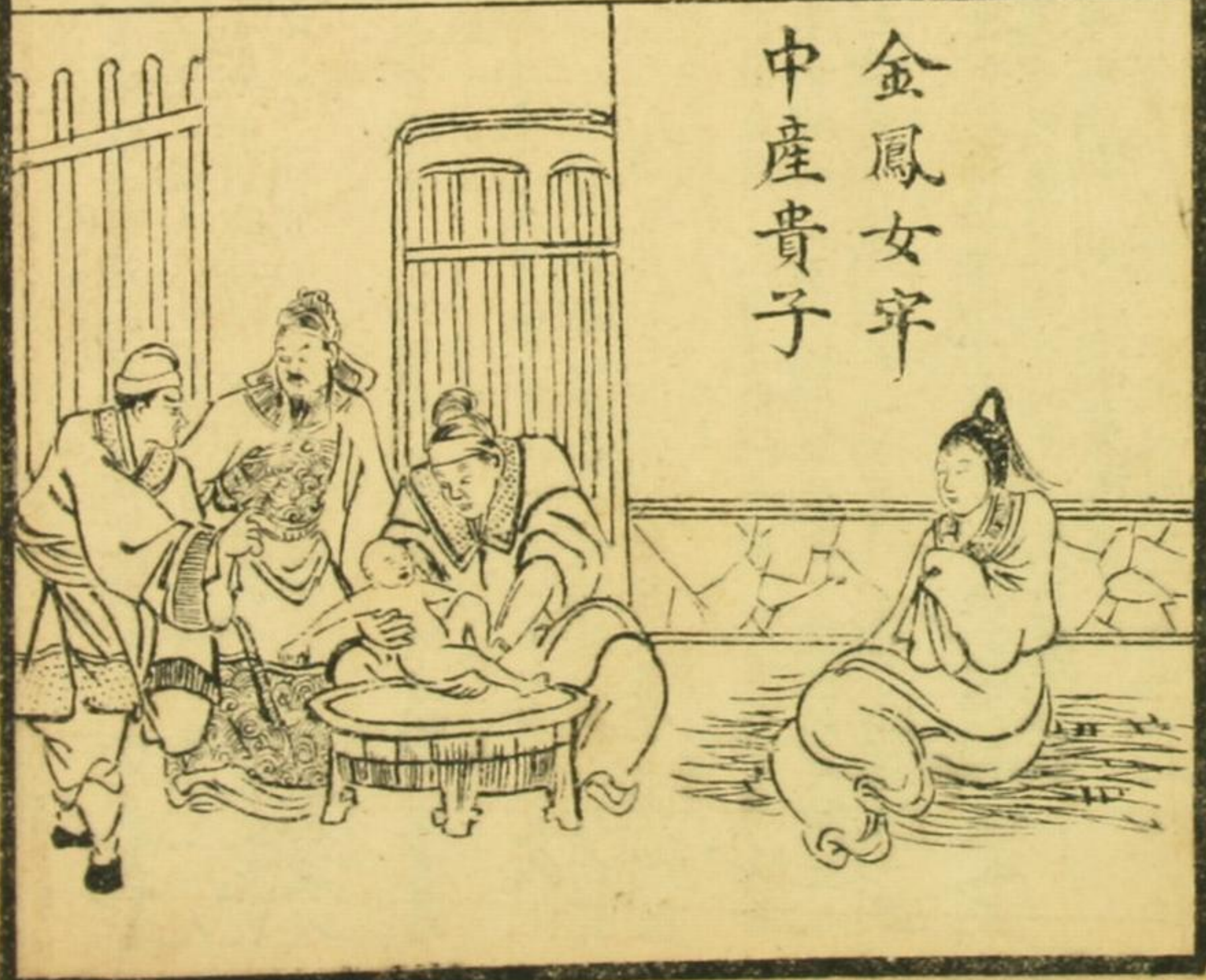
金鳳女牢中產貴子