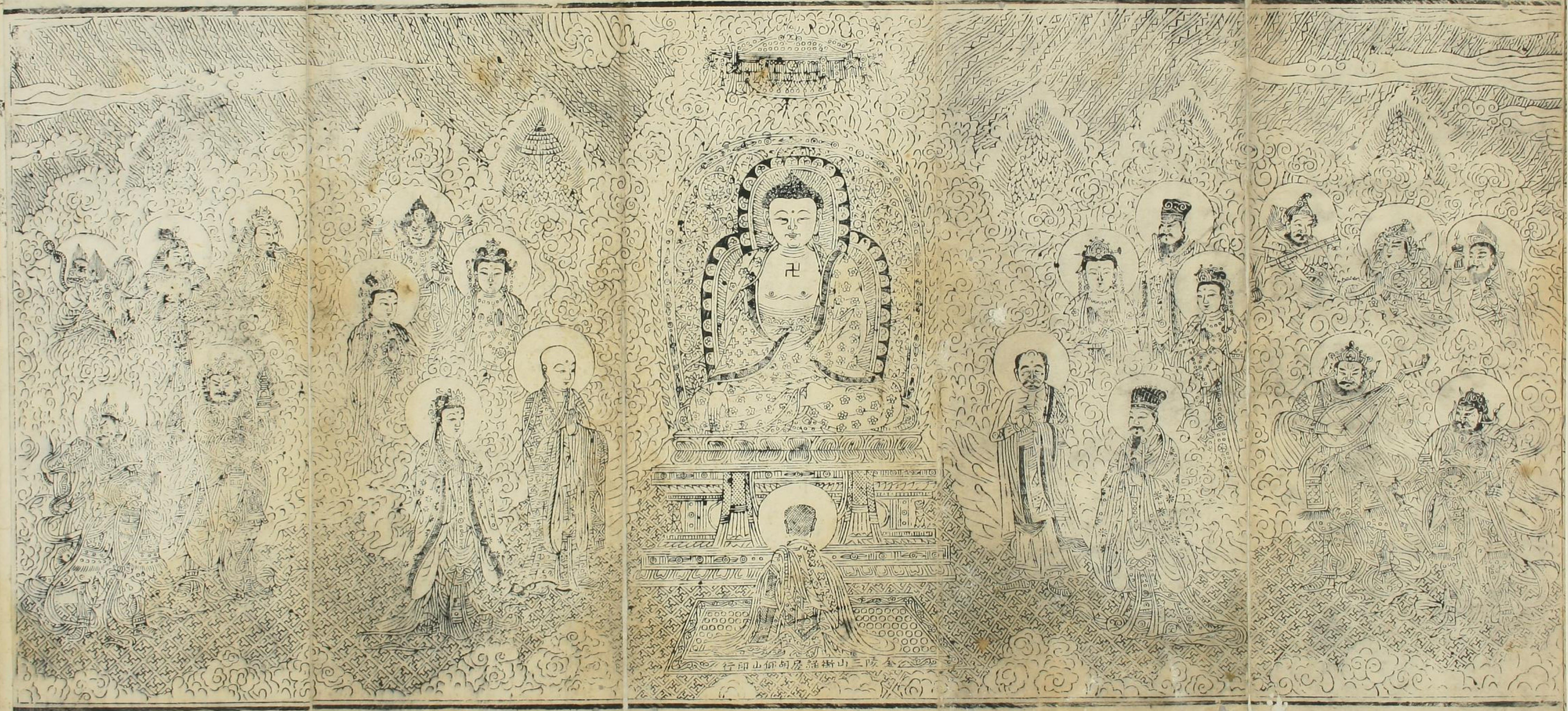
行印山仰胡房羅樹山三院全