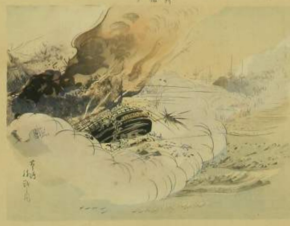
一 分捕 二 上り 三 大正堂 四 豊島