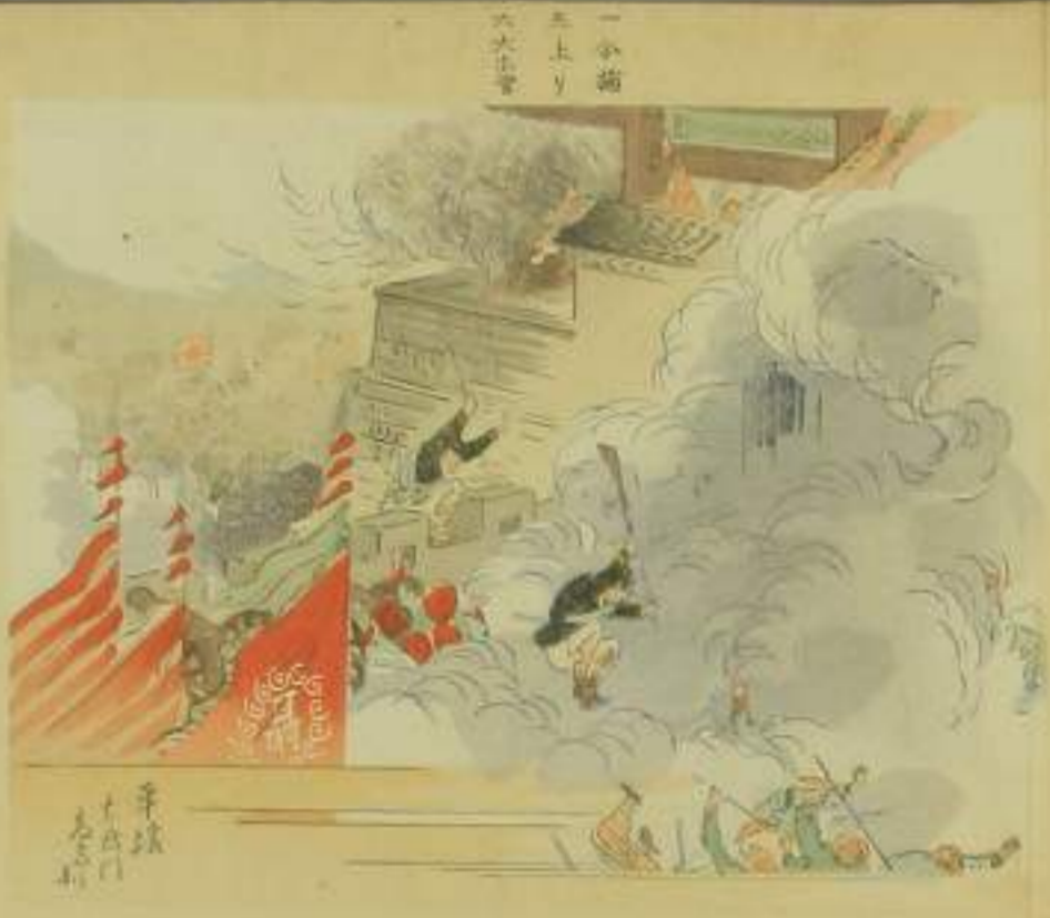
一 分捕 二 上り 三 大正堂 四 豊島