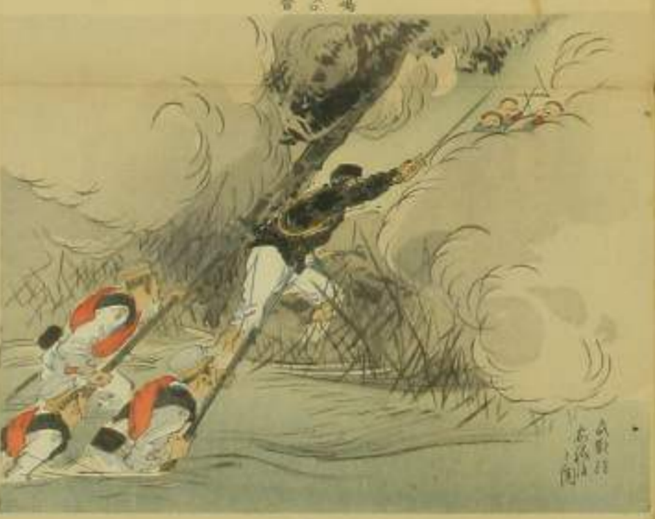
一 分捕 二 上り 三 大正堂 四 豊島