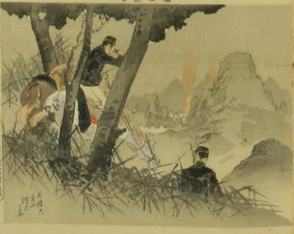
一 分捕 二 上り 三 大正堂 四 豊島