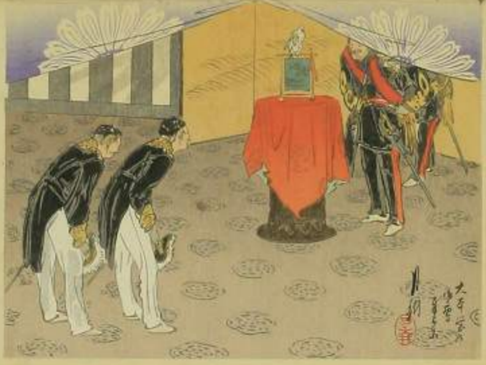
一 上り 二 大正堂 三 豊島 四 分捕