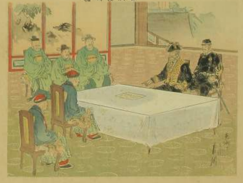
一 分捕 二 上り 三 大正堂 四 豊島