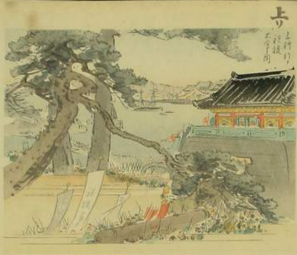
上 上野 上野