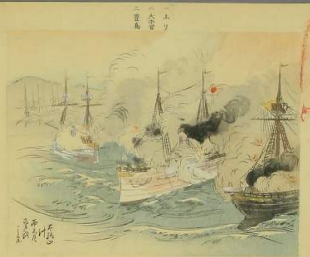
一 上り 二 大正堂 三 豊島