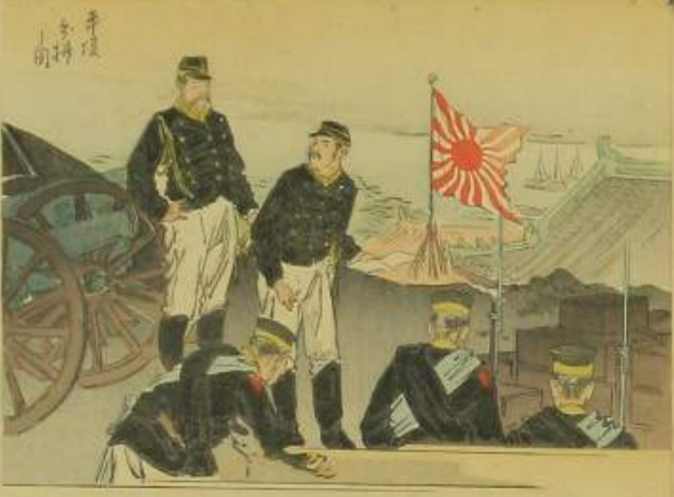
一 分捕 二 上り 三 大正堂 四 豊島