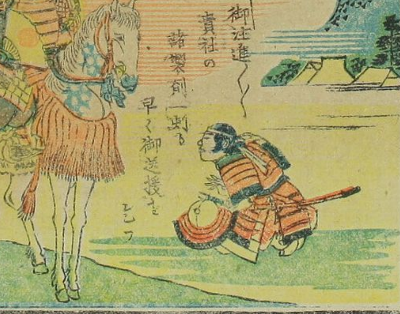
近江製劑會社名合月望劑製江近