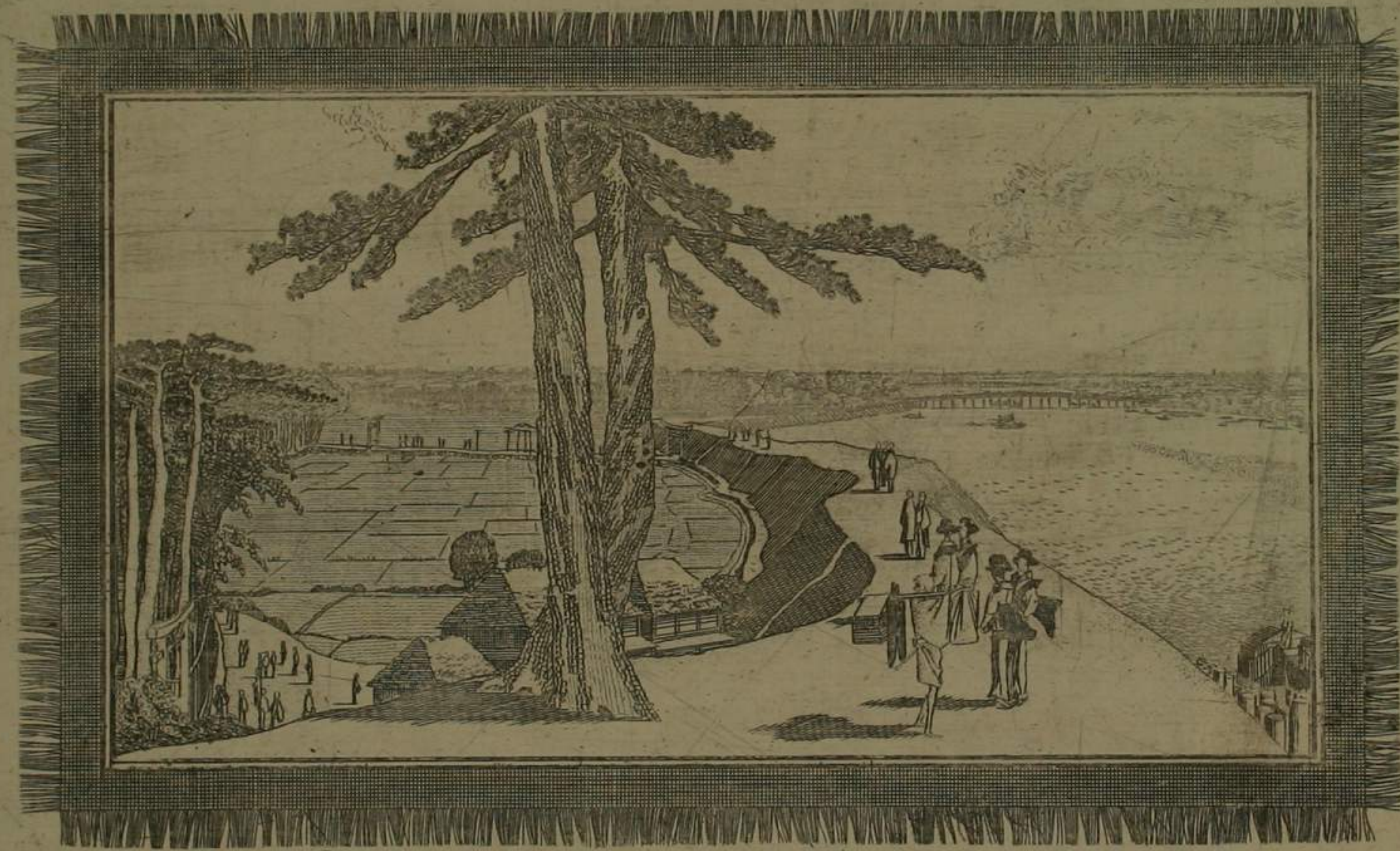
三圖眺望之園 亞歐堂