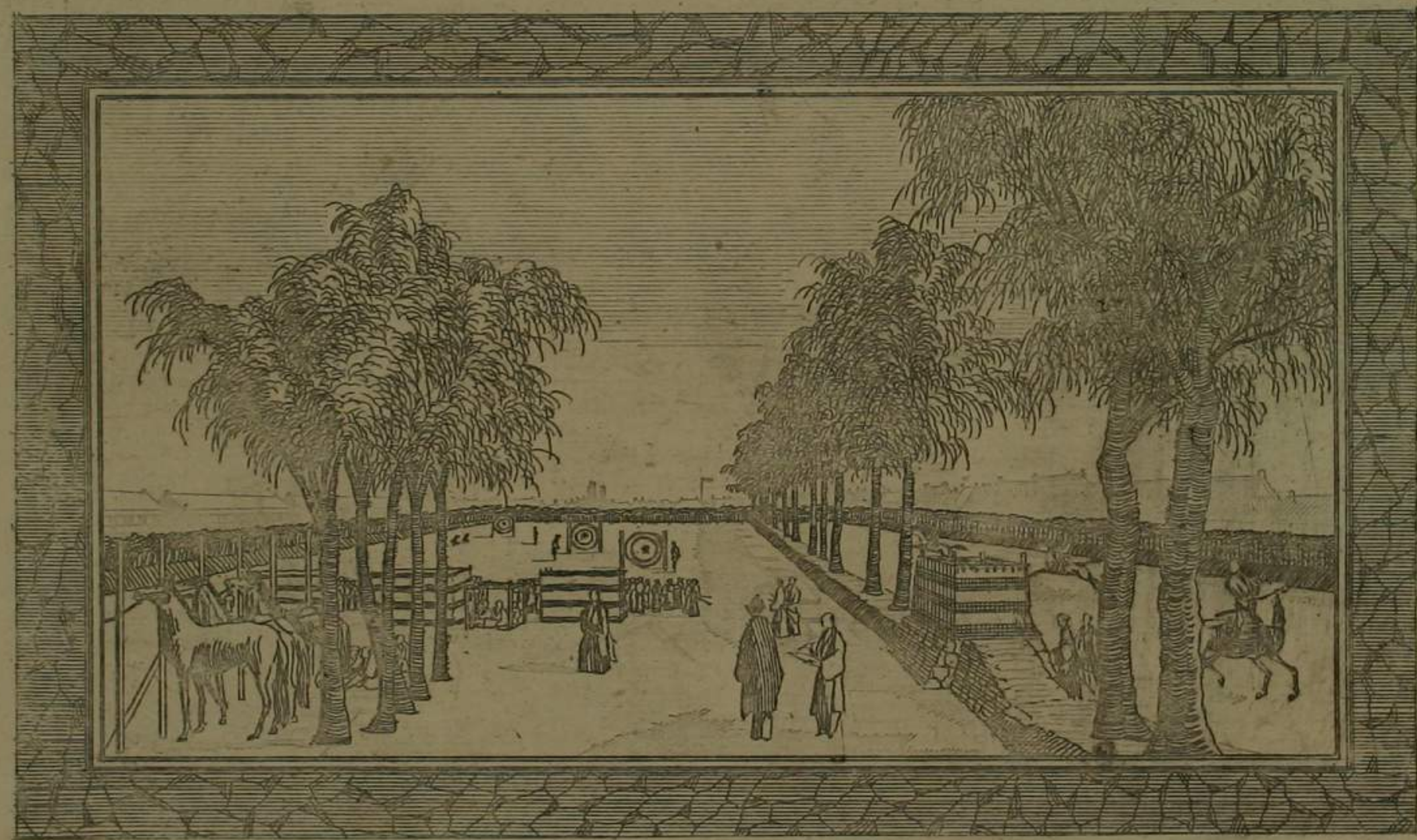
亞歐堂 櫻田馬場射御之圖