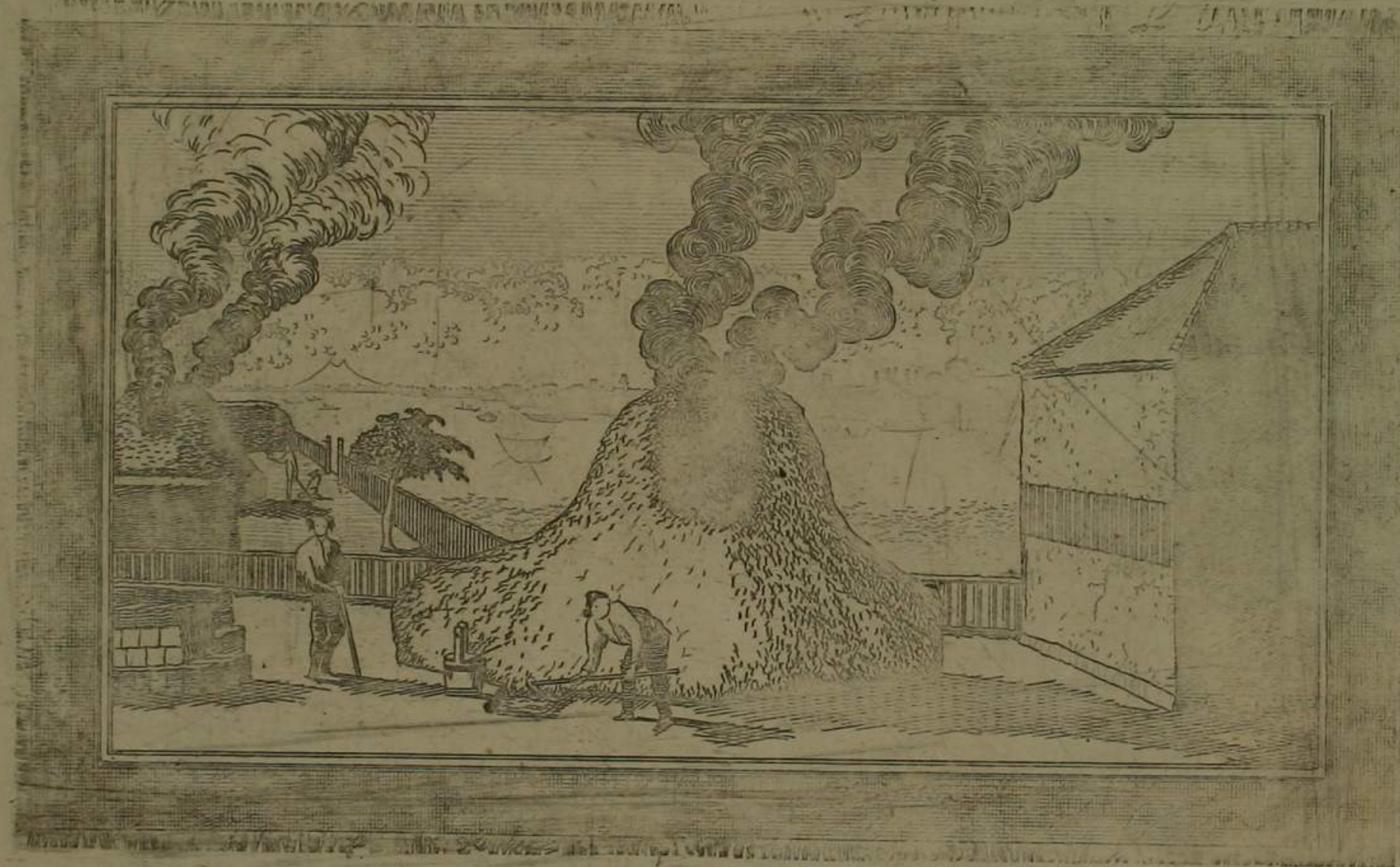
亞歐堂 今戶尾燒之圖