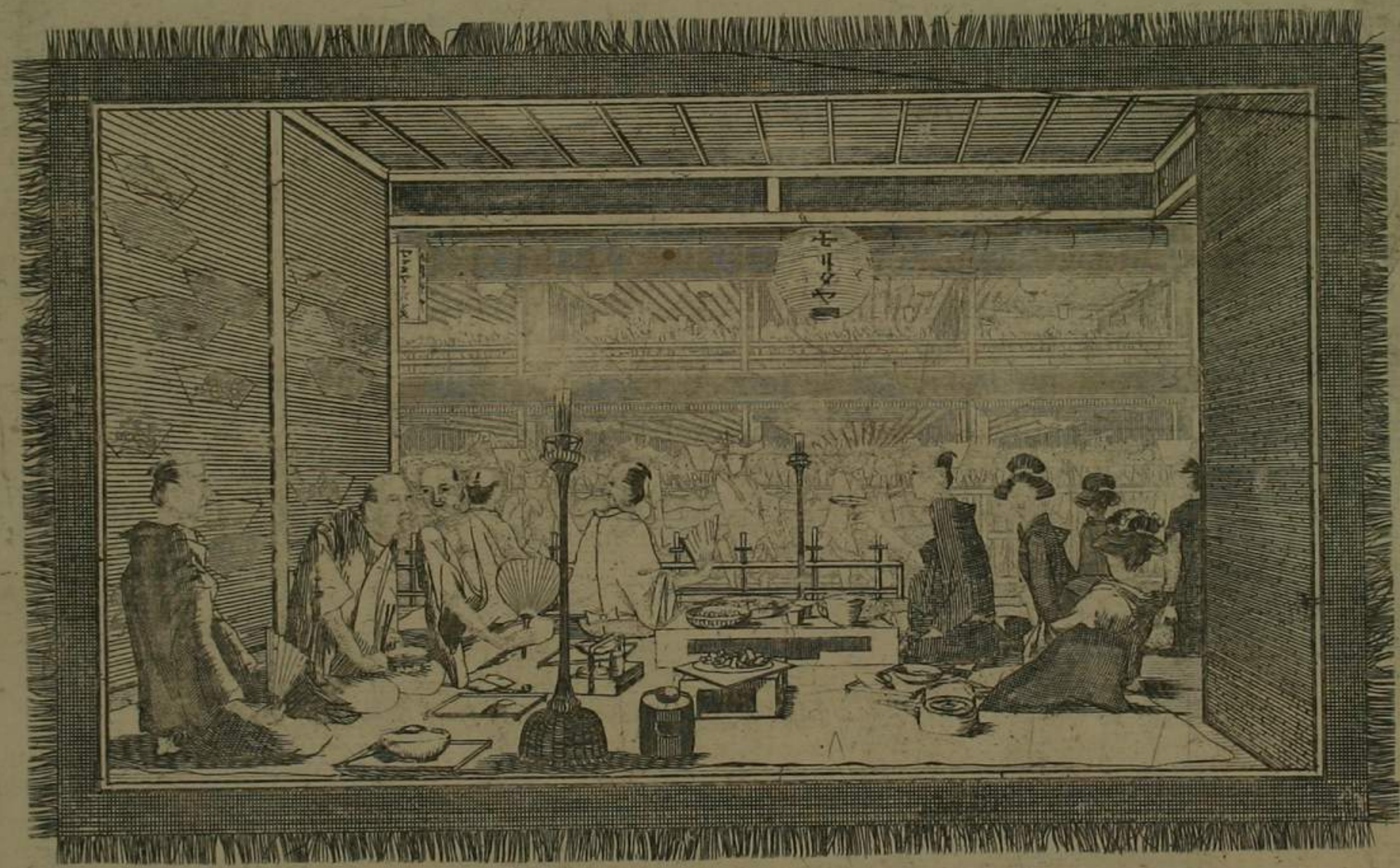
新吉原夜俄之圖 垂飲堂