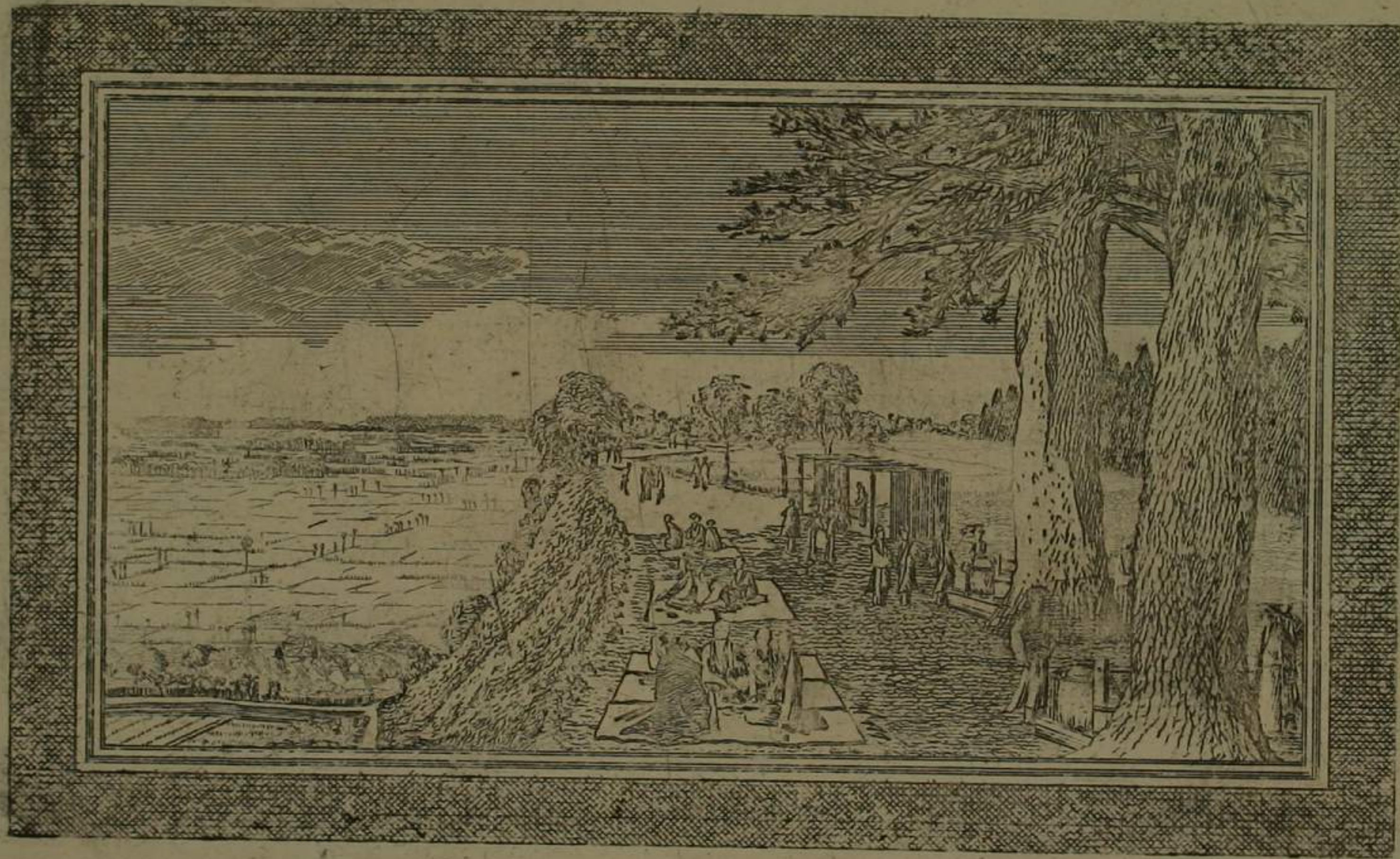
白道港山望鴻臺之圖