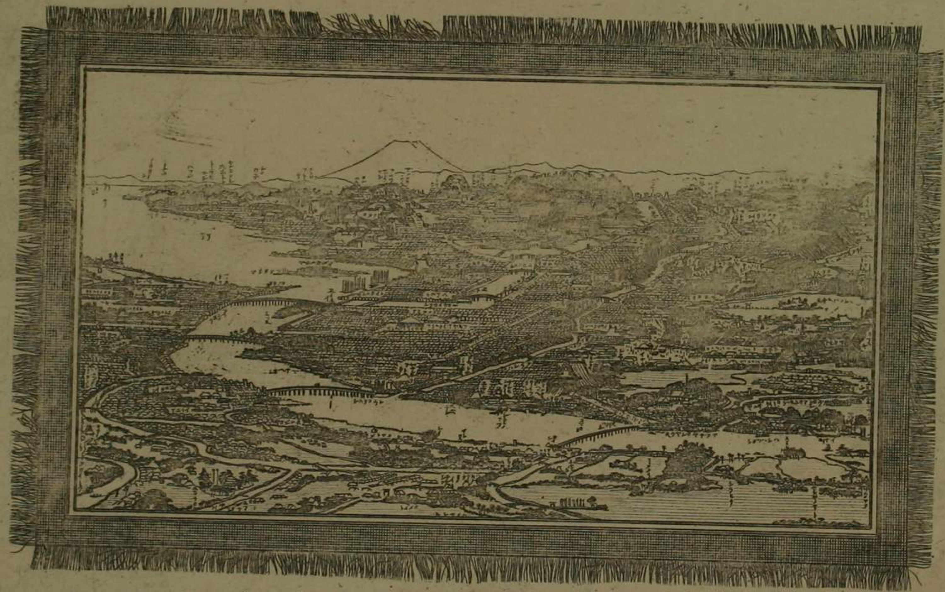
東 都 名 所 全 圖 亞 歐 堂