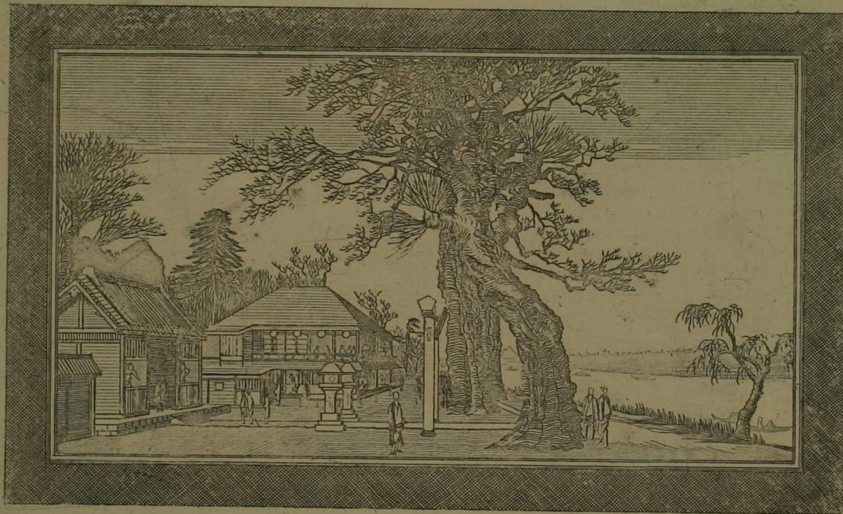
坐歐亞 望眺川田隅荷稻先洲真