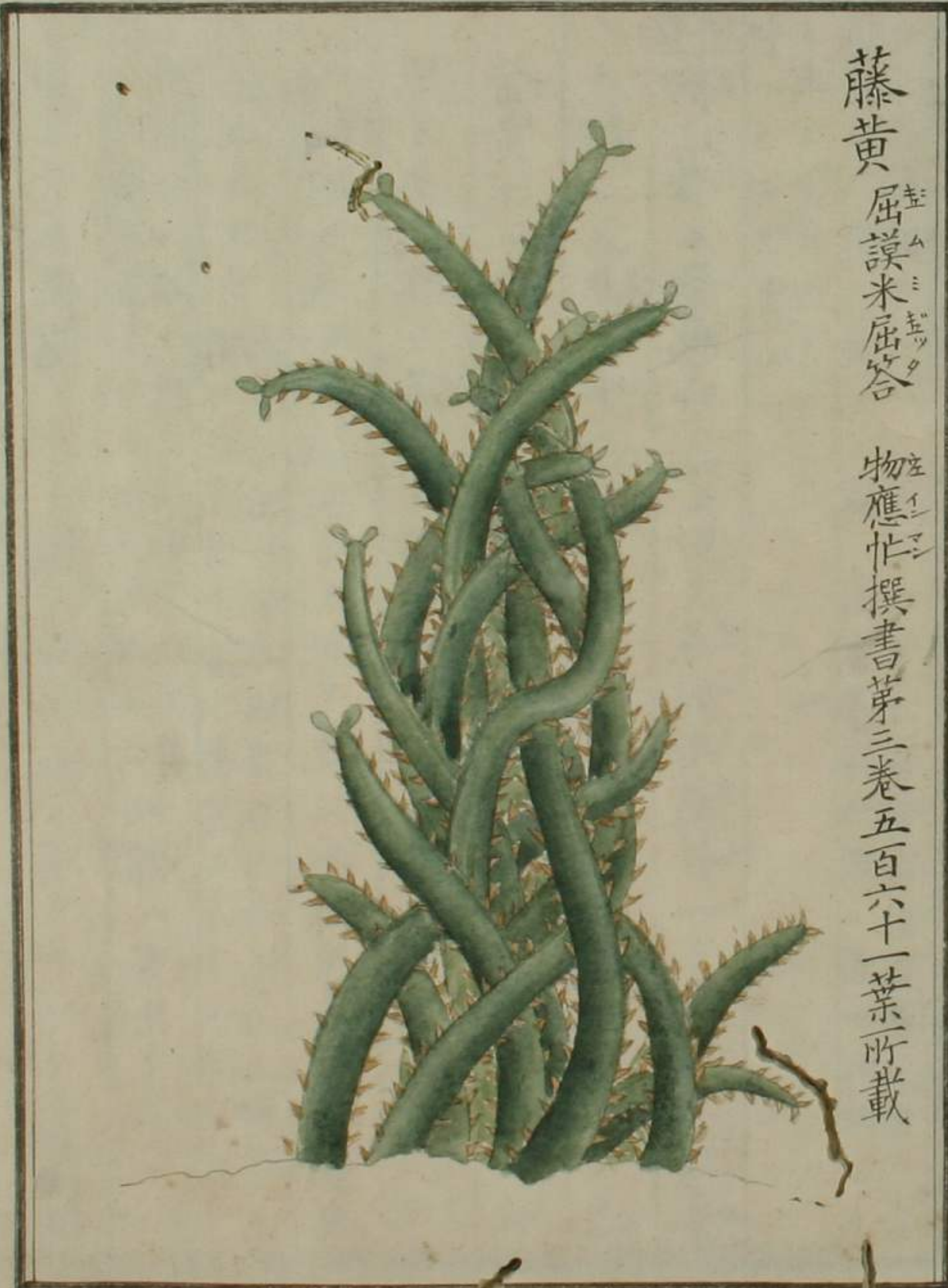
藤黄 屈謨米屈答 物應忙撰書第三卷五百六十一葉所載

此物 壹云ニ壹ツタナラカレハ 何種タルヘキヤ真種ハ 大相違ノ品ナリ也考アリ 正ウズル云ノ類近シ