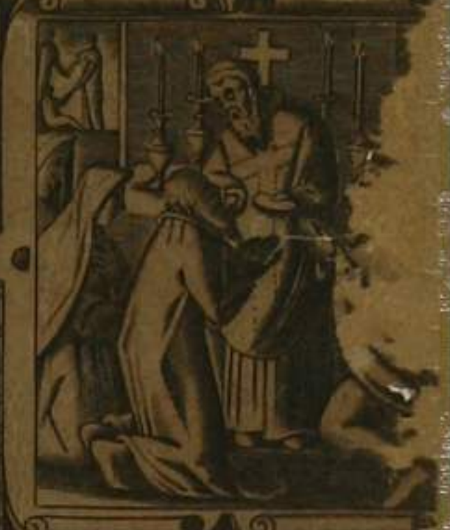
ET. SANCTA. ECCLESIA. CATHOLICA. SANCTORVM. COMMUNIO