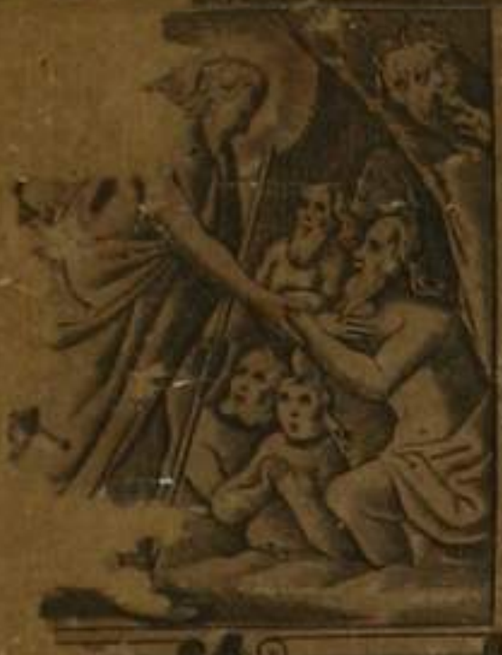
IN DIE AD INFEROS. TERRA ASCENDIT AD CELOS. SEDIT AD DE-