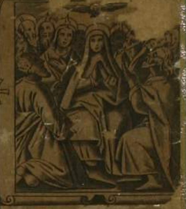
CREDO IN SPIRITVM SANCTVM