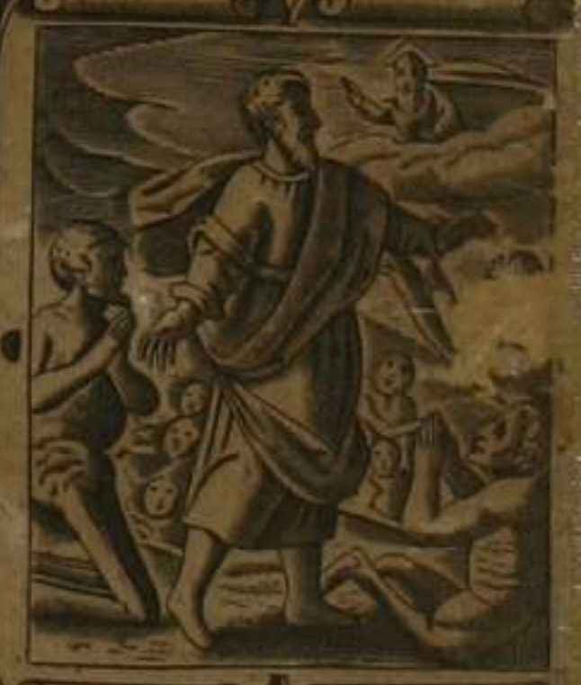
CARNIS. RESVRR. TIONEM