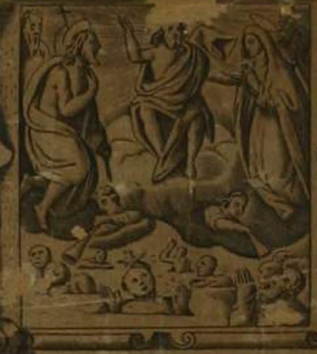
INDE. VENTVRVS. EST. IVDICA. RE VIVOS. ET. MORTVOS

DVODECIM ARTICVLI SIMBOLI APOSTOLICI ICONIBVS EXPRESSI