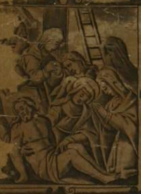
IN PUNTO. FLATO. CRV. I. MORITVS. ET. SEPVLTVS