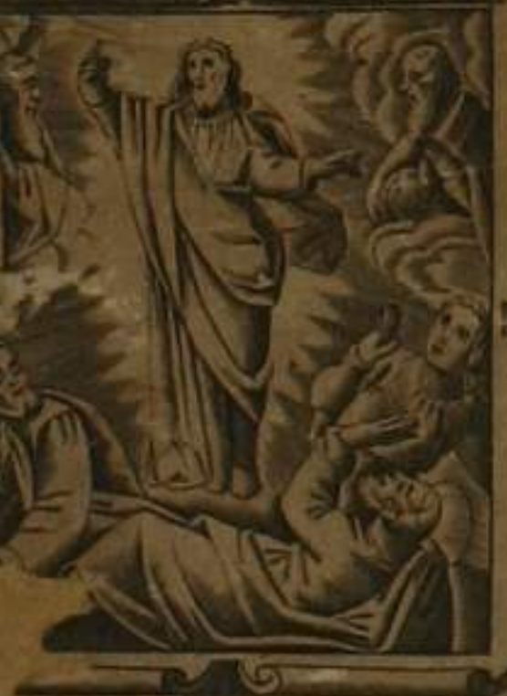
IN. IESVM. CHRISTVM. FILIVM. MEIVS. VIVIC. AD. DOMINVM. NOSTRVM