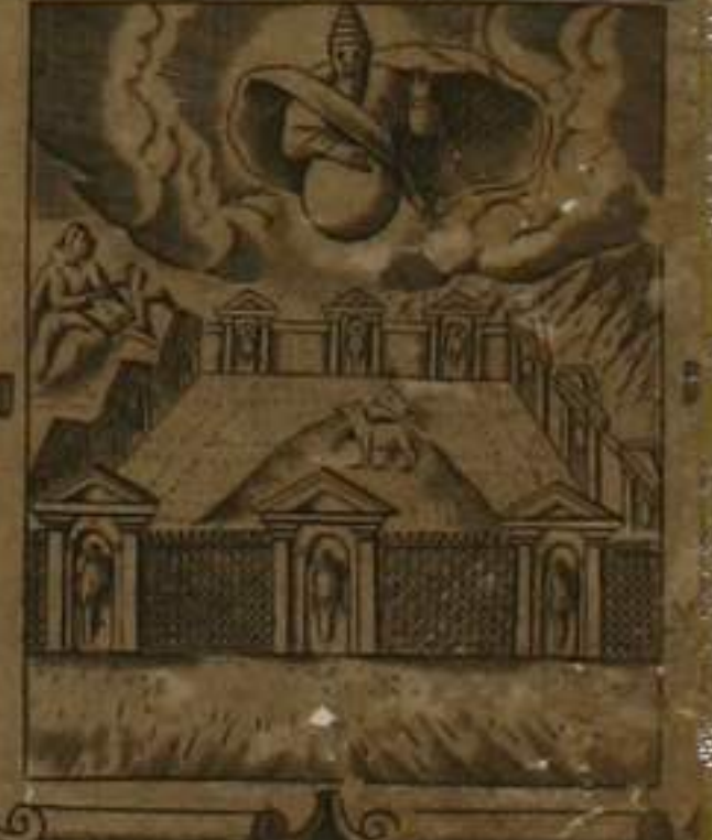
VITAM. AETERNAM. 481

SINE FIDE IMPOSSIBILE EST PLACERE DEO CRED ERE ENIM OPORTET ACCE DENTEM AD DEVM QVIA EST ET INQUIRENTIBV SE REMNERATOR SIT Heb. 11. 1 PER MISERICORDIAM ET FIDEM PVPGANTVR PECCATA Proverb. 1. 27.