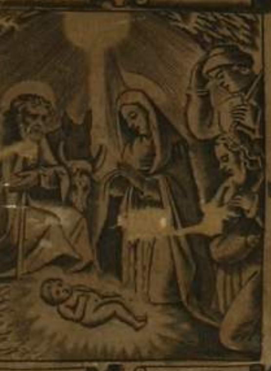
IN. CONCEPTVS. EST. DE. SPIRITV. TO. NATVS. EX. MARIA. VIRGINE