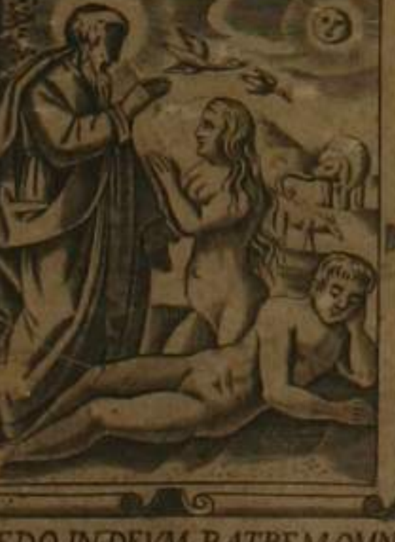
CREDO. IN. DEVM. PATRE. M. OMNIPOT. TEM. CREATOR. C. ELI. ET. TERRA

OMNE. QVOD. NATVM EST. EX. DEO. VINCIT MUNDVM. MET. HAC. EST VICTORIA. QVAE VINCIT. MNDVM FIDES. NOSTRA I. IOAN. 5. 4.