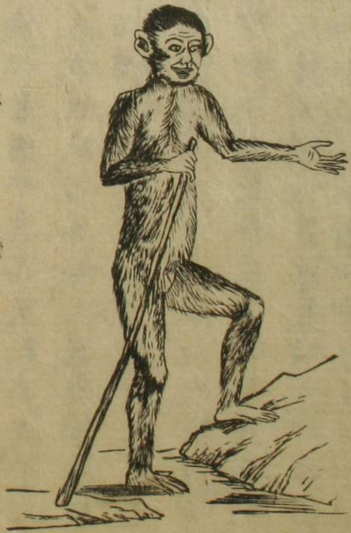
按此圖恐非真者 與舶來生物甚異也

寬政十二年庚申夏和蘭商船復載來此物其夥 長斯密多者所畜而安卧辣國所產云入津後樊 畜諸長崎稅官高木氏莊此為供進貢之資也 云比向以壬子來者甚巨太頗老獸也其面自頤 至額凡七寸二分許自臀至項背行大約一尺四 寸許腕後至肩頭長一尺七寸八分許自腕前過 掌至中指六寸六分許自脚腕至腿股長一尺二 寸許自足跟至距八寸許云性沈勇不驚其行也 開兩肢蹠而遲步馴而喜負人肩支節堅強而有 力人試出示所把之扇伸其手徐握搦之不肯放