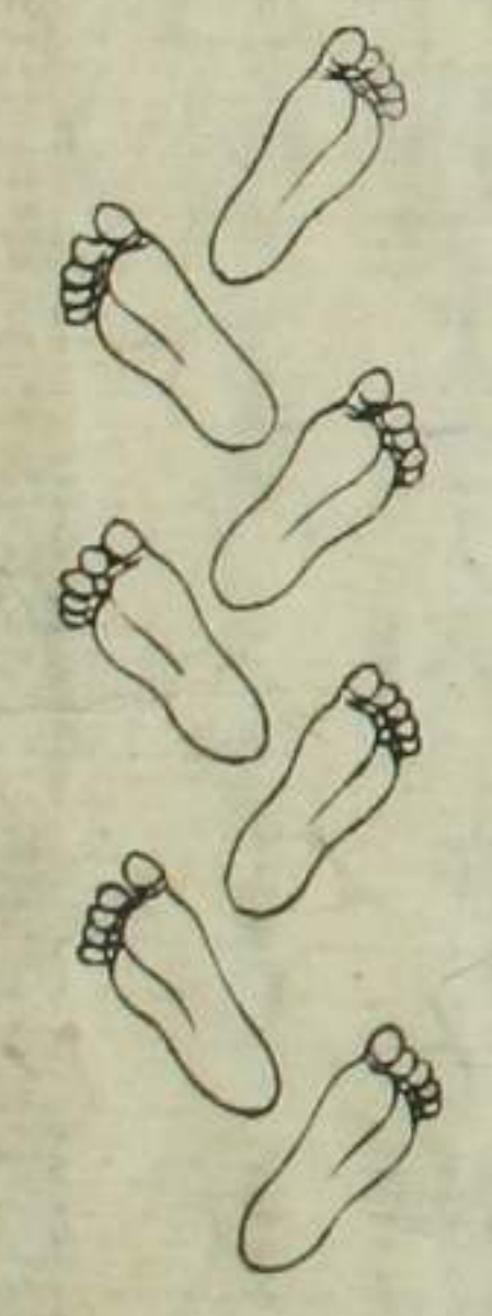
かくよの足と めらうてあ

生樂うお髑と内うふえんを とお鳥よとびまのり人うり自 たらし思とも他より見す付い生樂の 外髑おうまらとらうありがけ