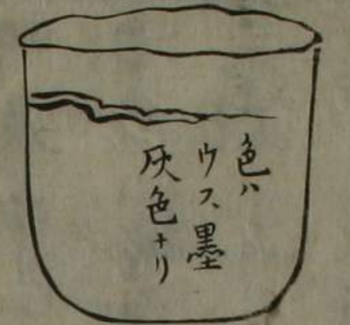
色ハ ウス墨 灰色ナリ

祠も多し建より数に二里右乃方入足守也木下 疾 コウ 二万五 千石 の領地も陣屋も黒宮氏の途中に石名古礎より 了径二尺余是の傍中足守賀陽郡溝手村賀陽寺乃古 跡より堀出を千年を越るもの又径尺五六寸余生焼の壺を 同賀陽郡巖山下より堀出を外鬼面瓦をえり肉をけり常