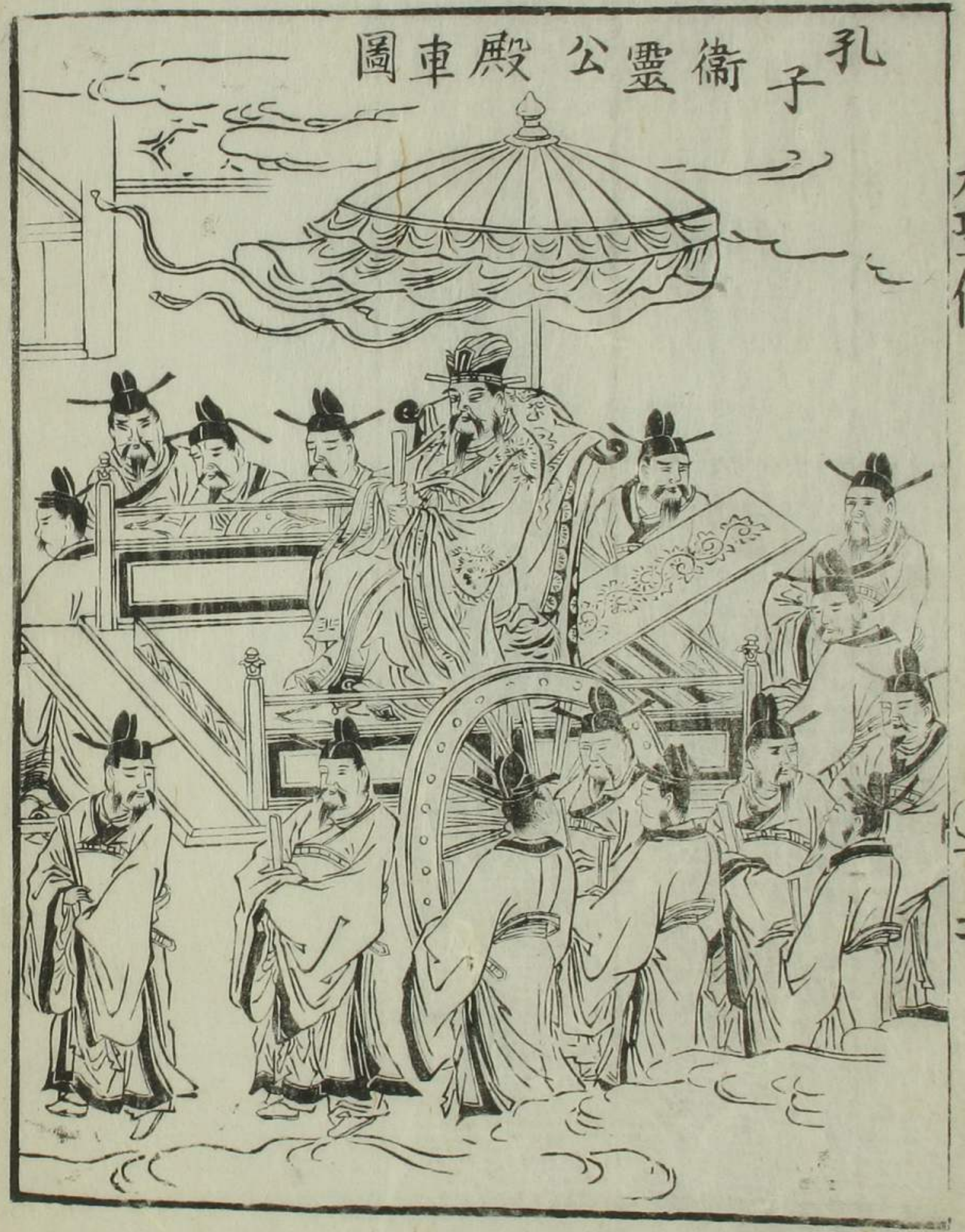
孔子衛靈公殿車圖