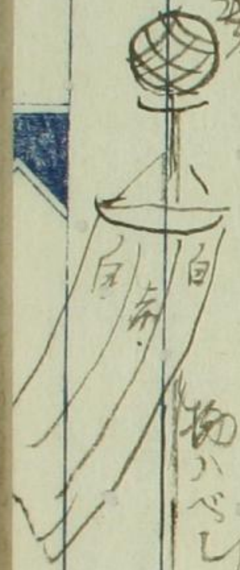
物ハベシススアリナリ