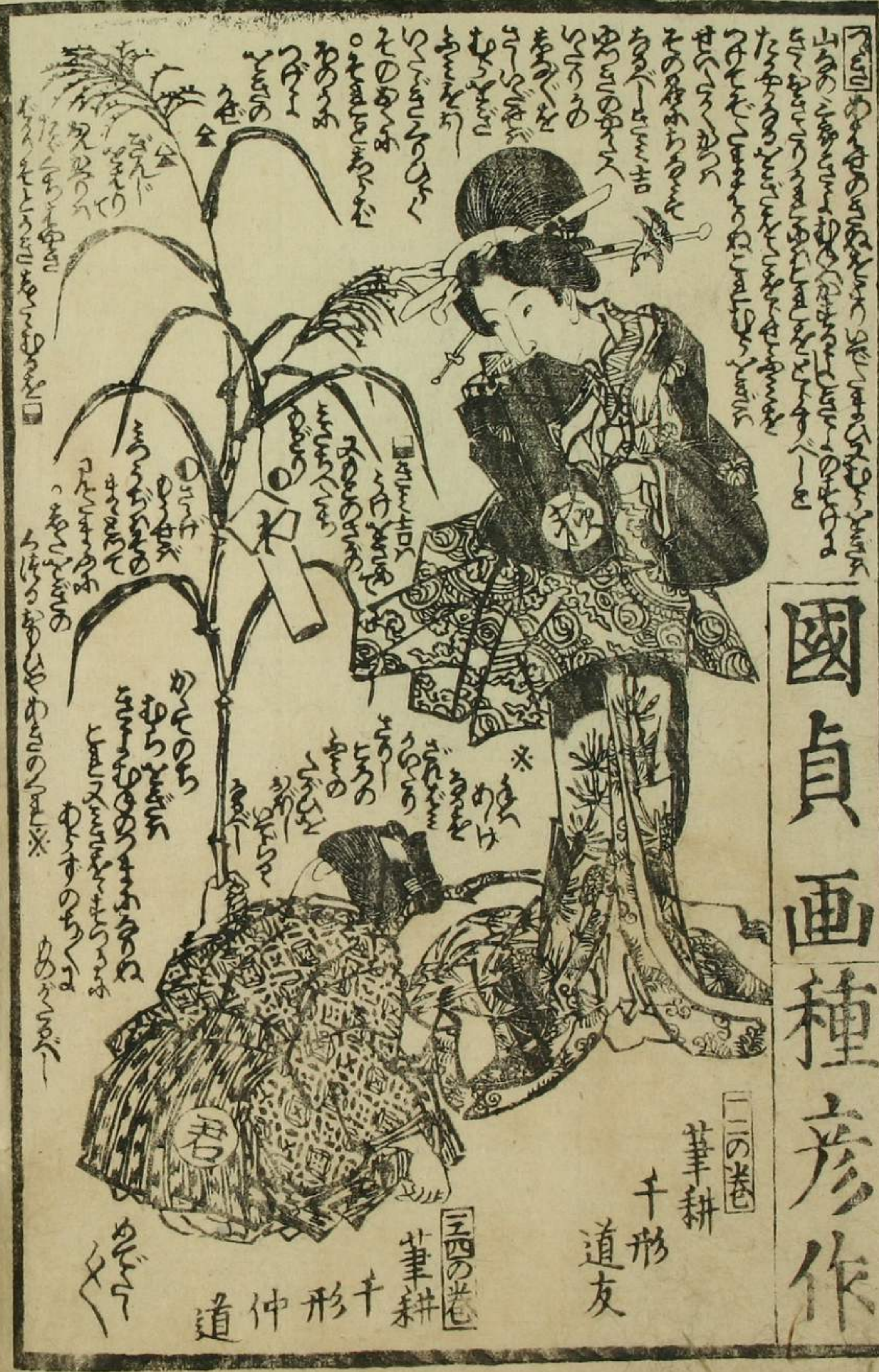
華耕 千形 道友