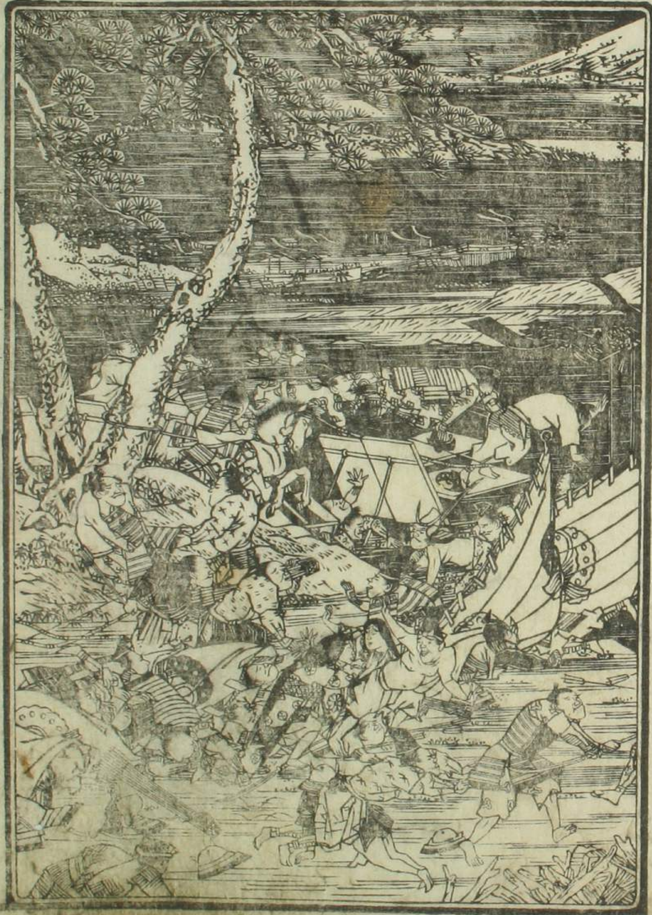
平家 富士川 陣拂 狼の 図