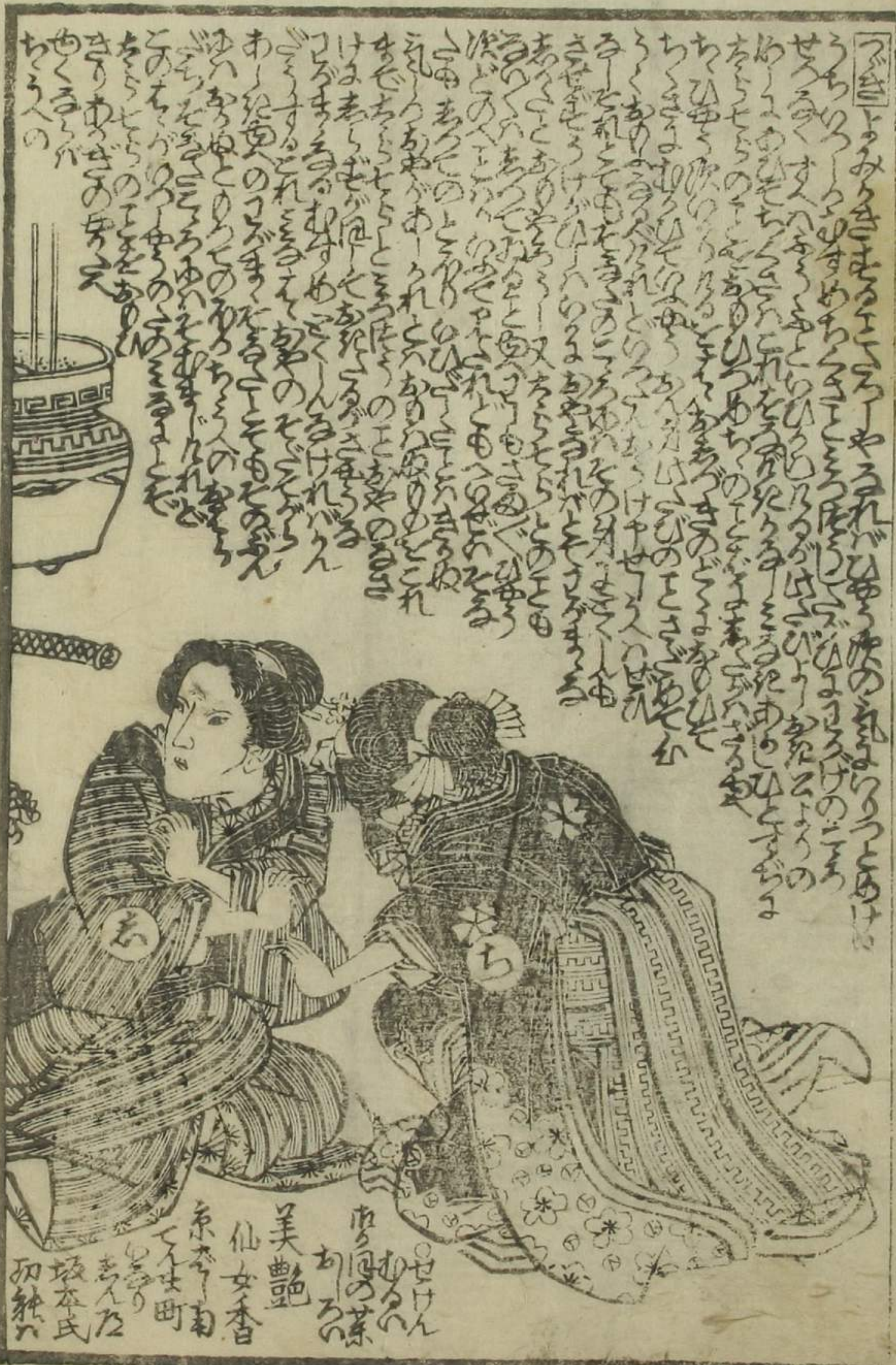
せけん あつちの茶 美艶 仙女香 京本町 坂本氏 初巻