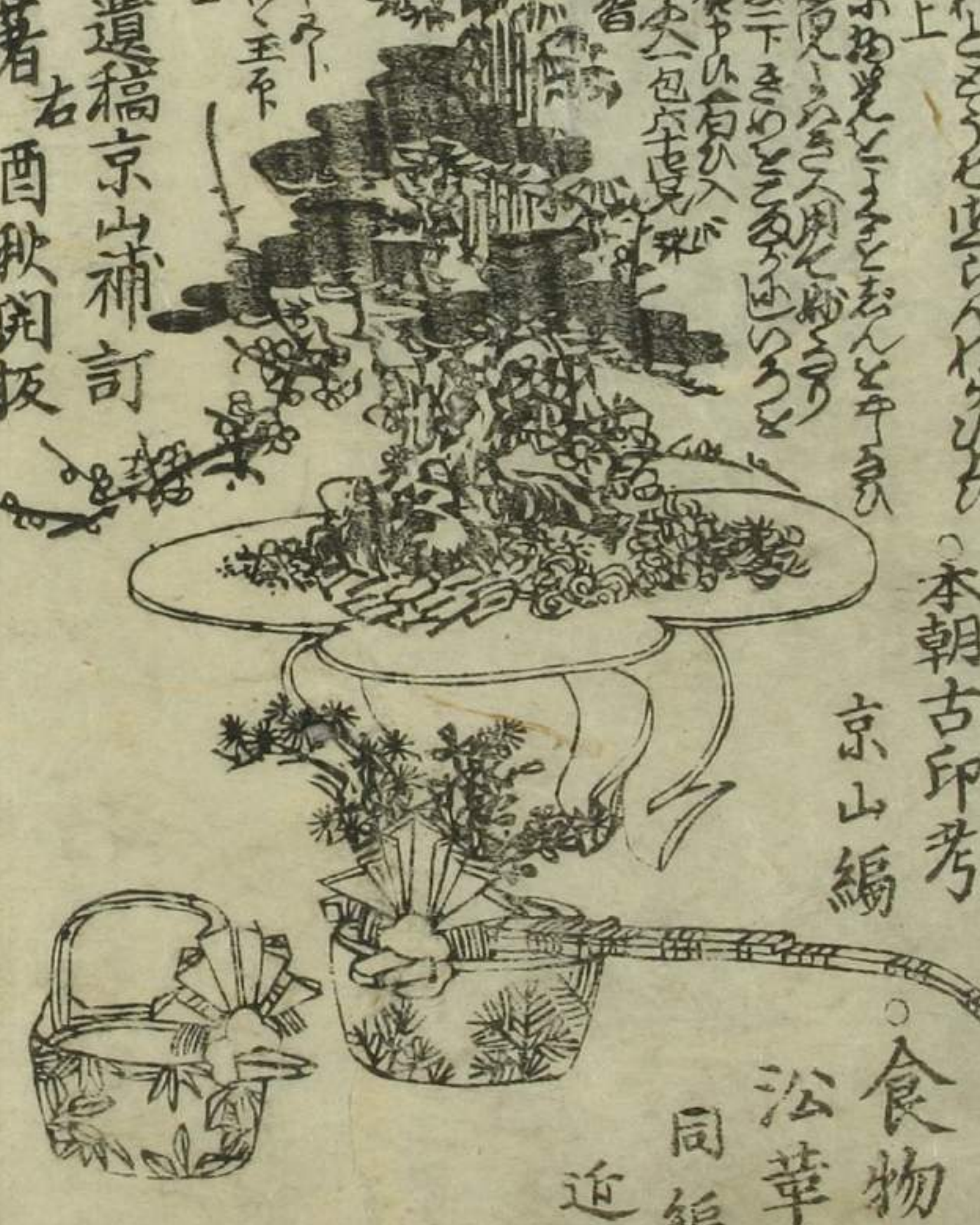
本朝古印考 京山編

○江上京山 京山百樹著 酉秋閑板 ○骨董集三編 京傳遺稿 京山補訂 ○女糖考 京山百樹著 酉秋閑板