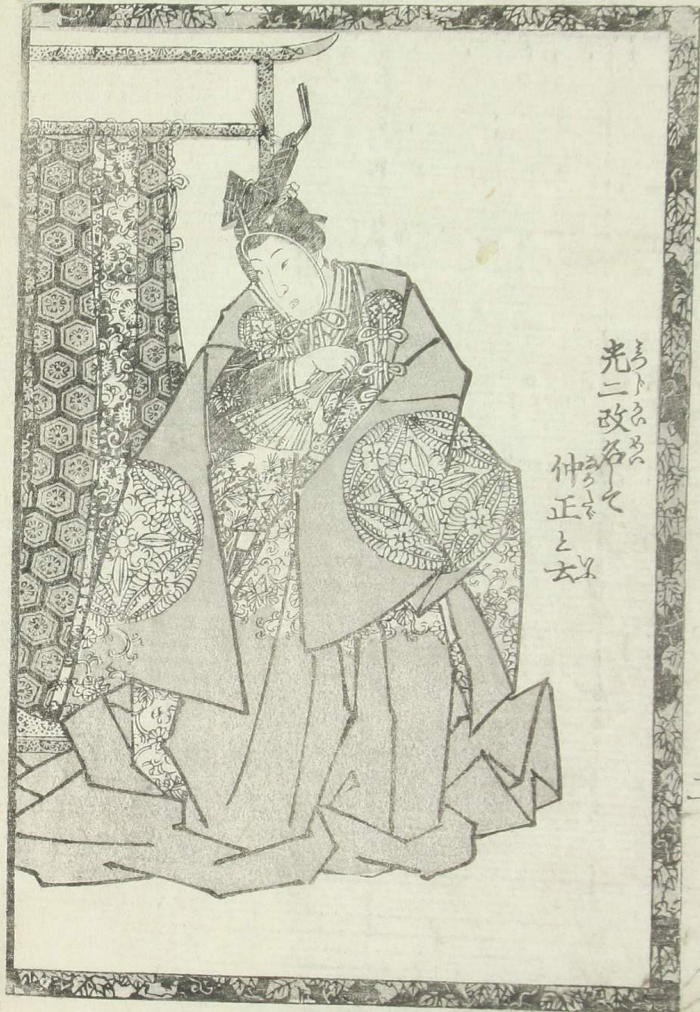
光二改各々 仲正と女