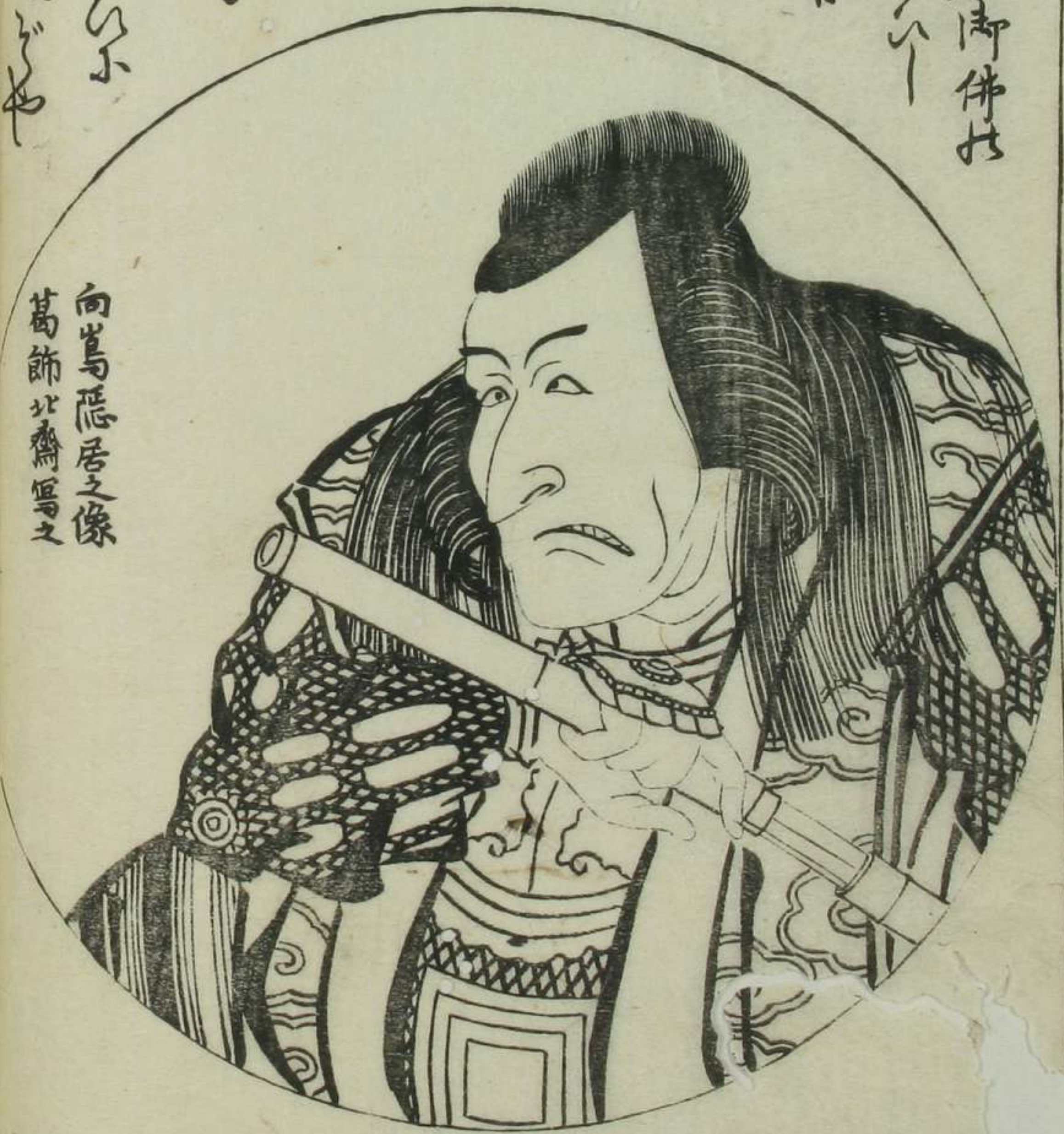
向島隠居之像 葛飾北齋寫之