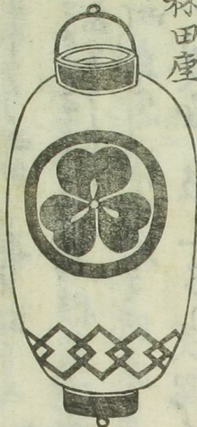
桐座 河原崎座 都座 略々