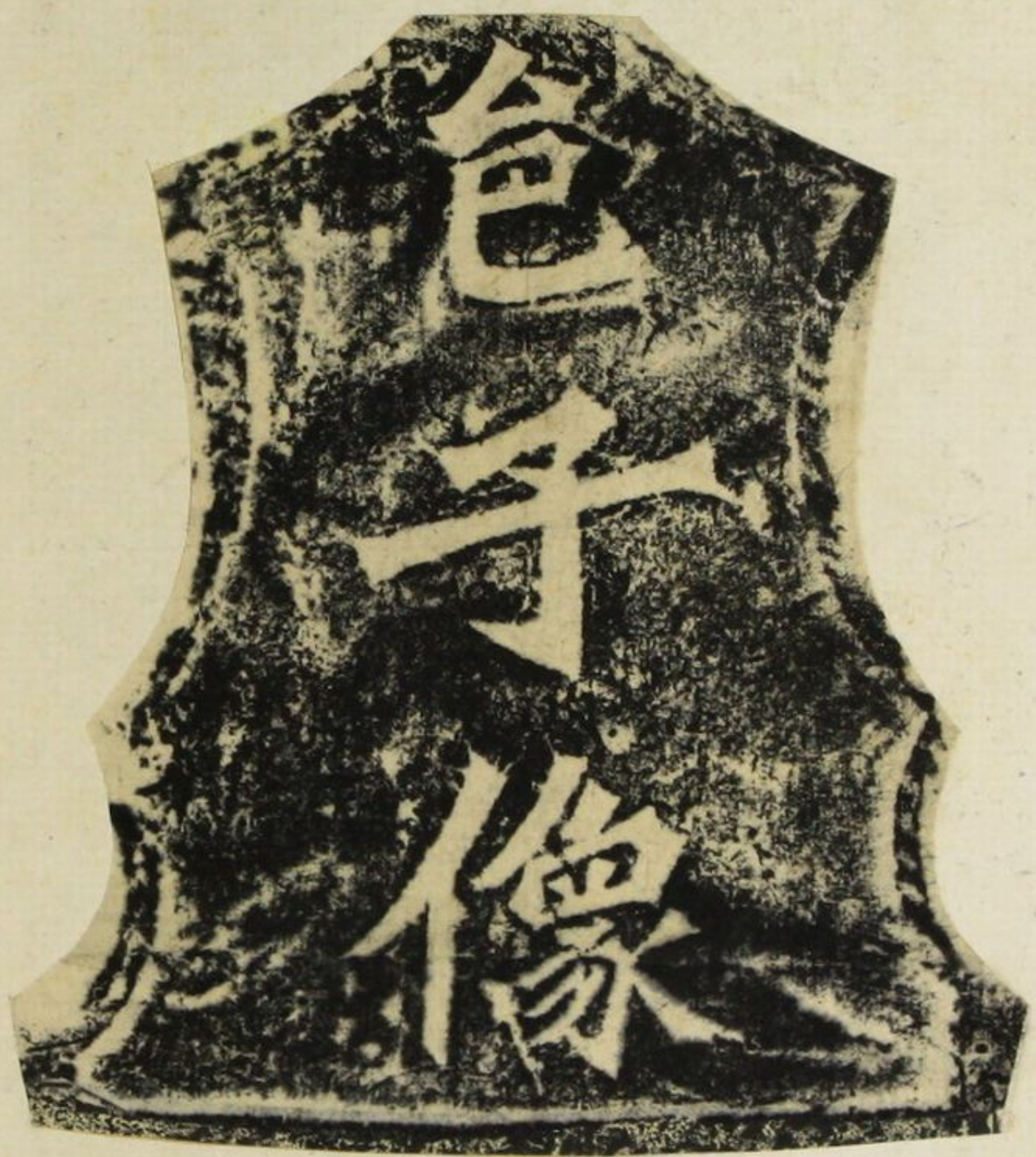
楊大眼為孝文皇帝生像記(無年月)