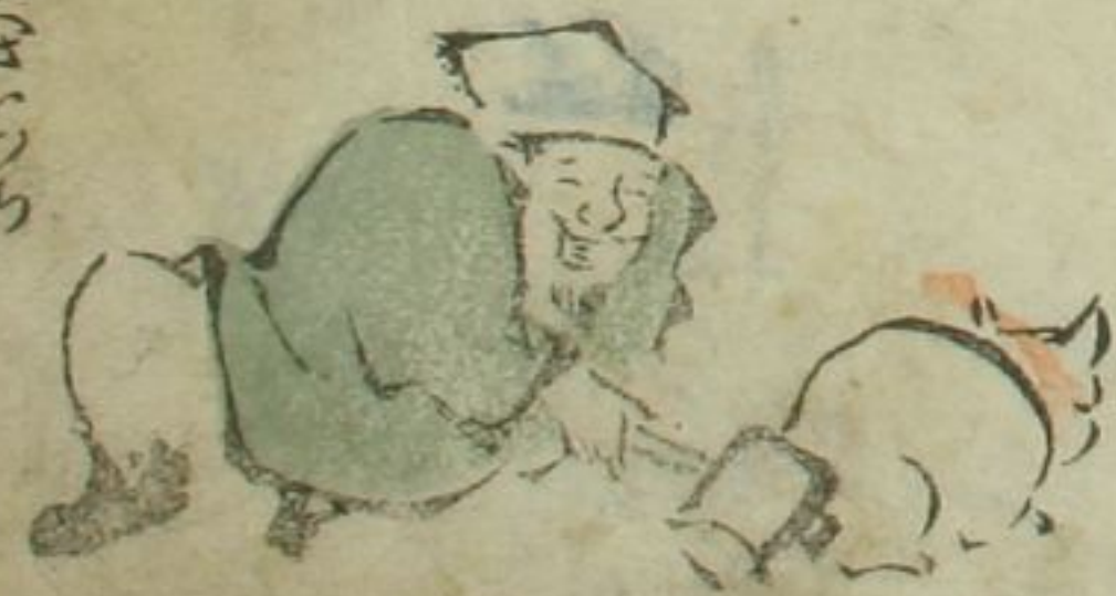
猫のまのまへんち