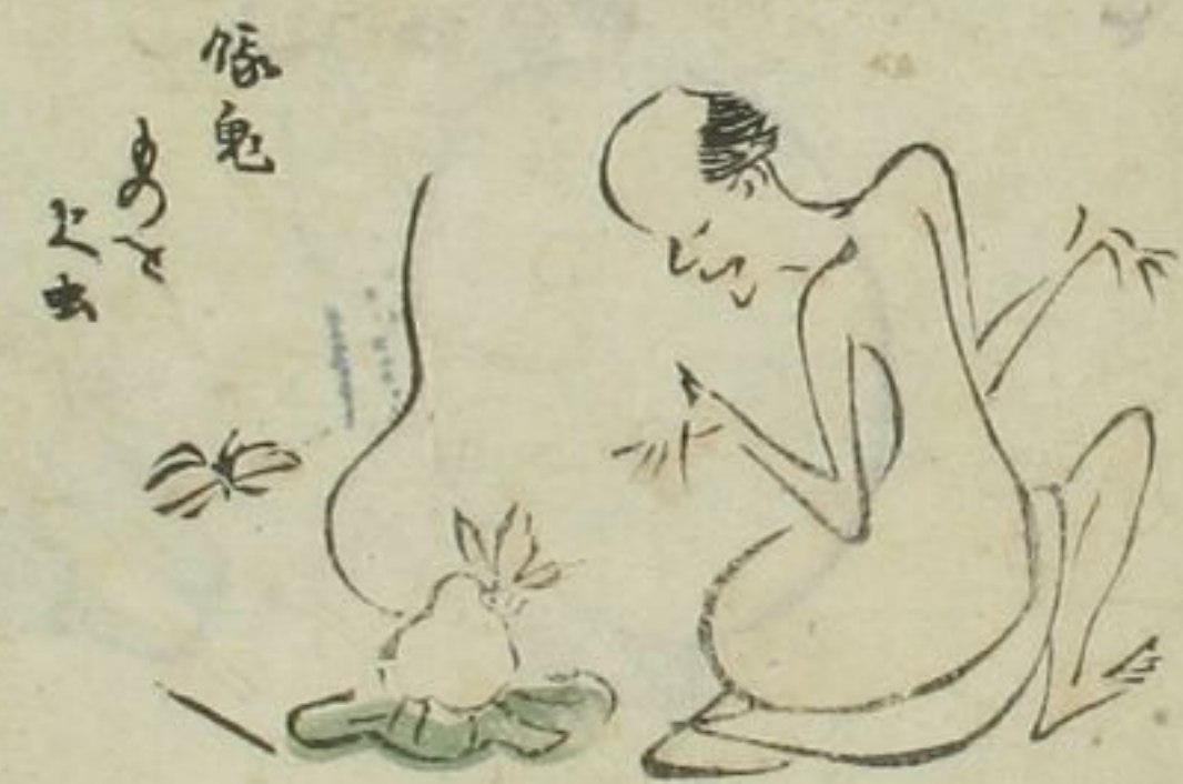
俗鬼 あめ よま