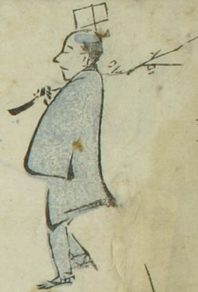
三巻のいしあふ 棒やろ