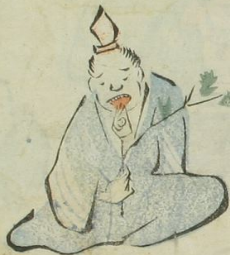
亭主のきんか あつらひ