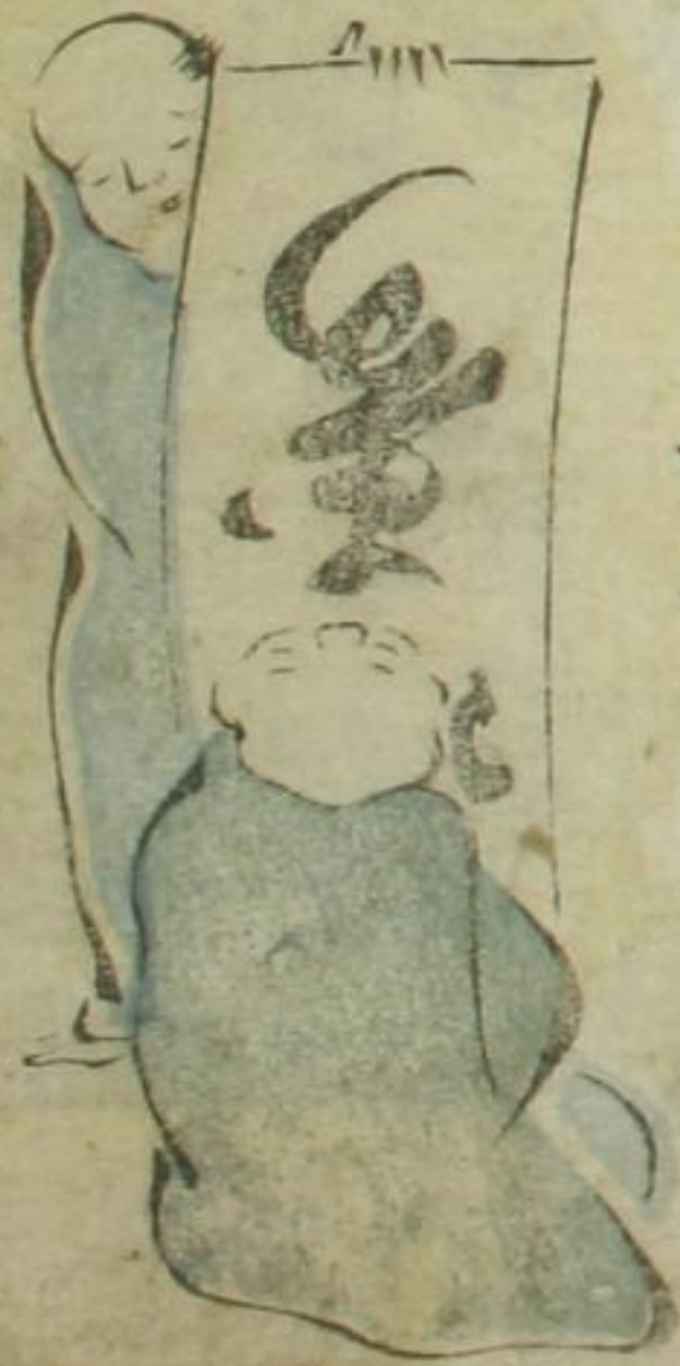
七西ん かひ ぬこ