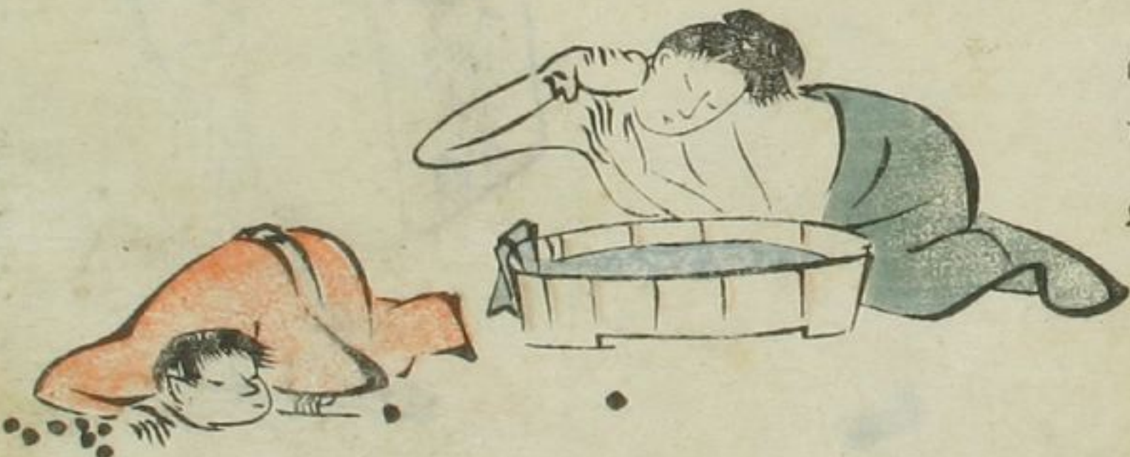
むらさき うしひた ひたすね