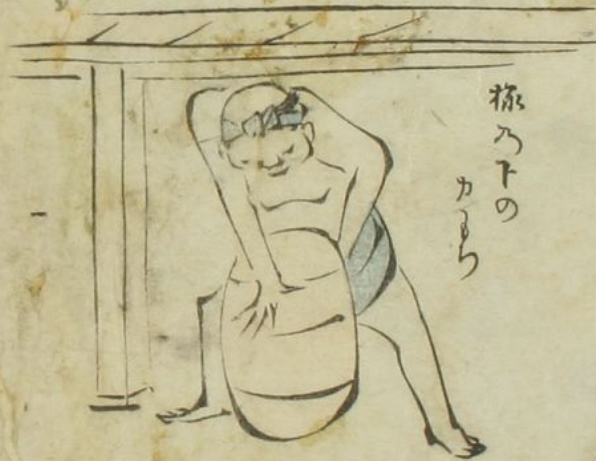
振 ろ の カ カ