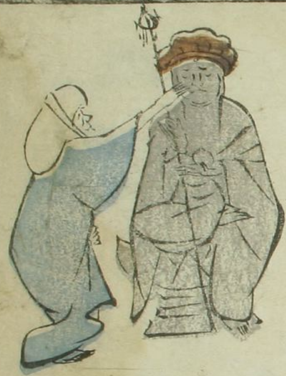
地蔵のふしどなまてまは