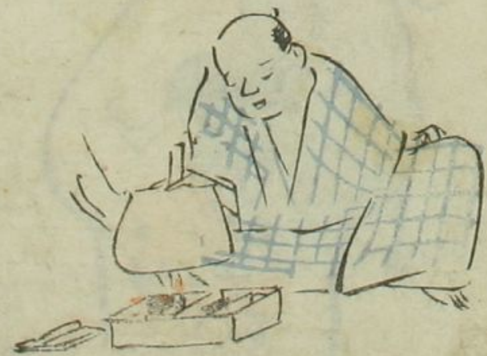
モチおきてやれいし