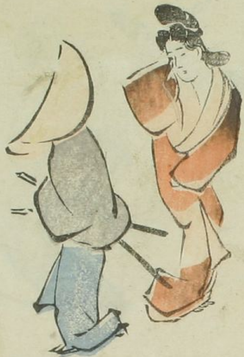
くせいのやうなこ