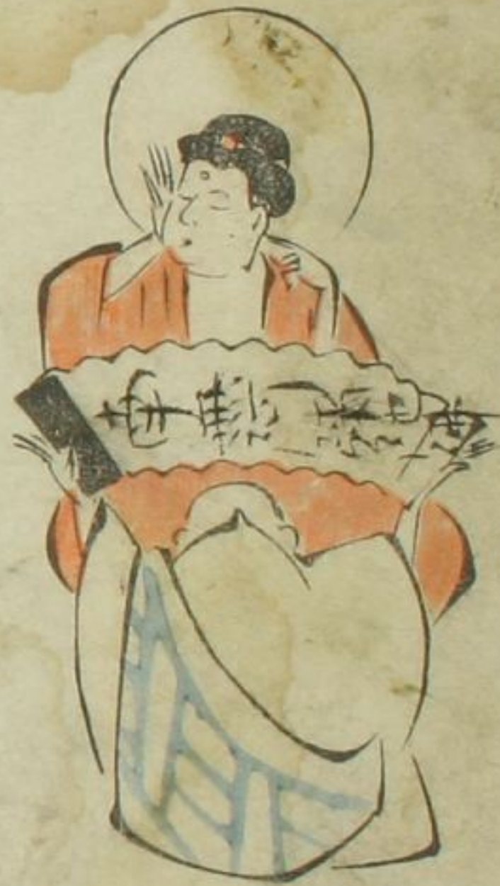
親 加 心 怪