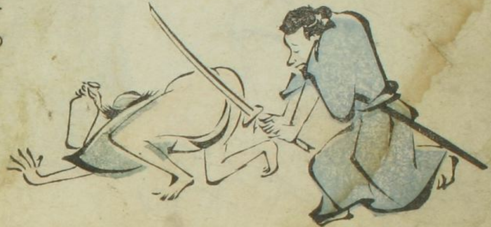
海とら て ま ま