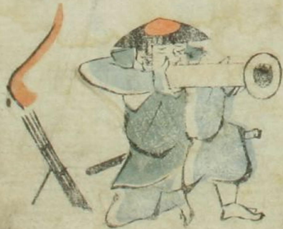
く ま 鉄泡 く ま