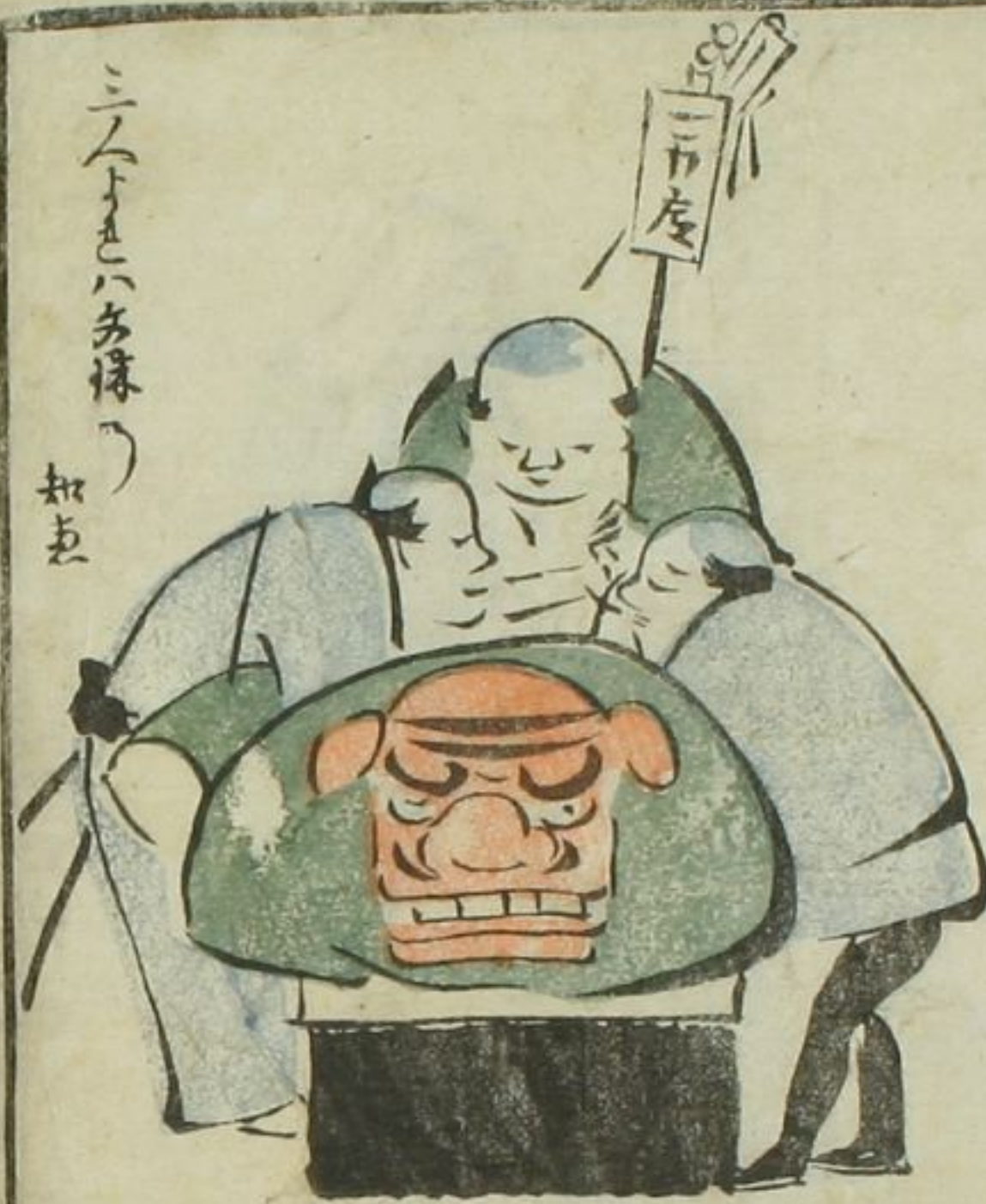
三人下まへ多様の おま