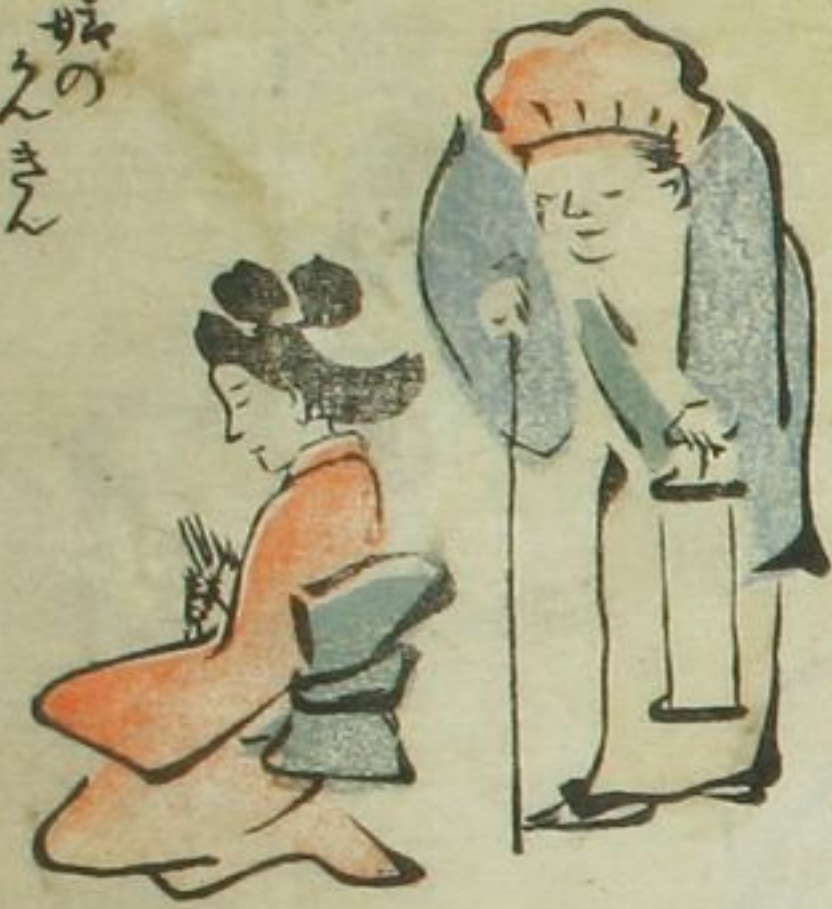
小娘の えきん とよりの花わらじ