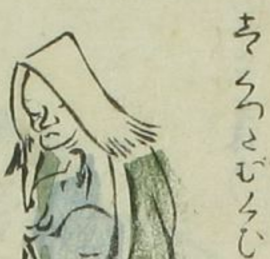
ちんちんちんちん