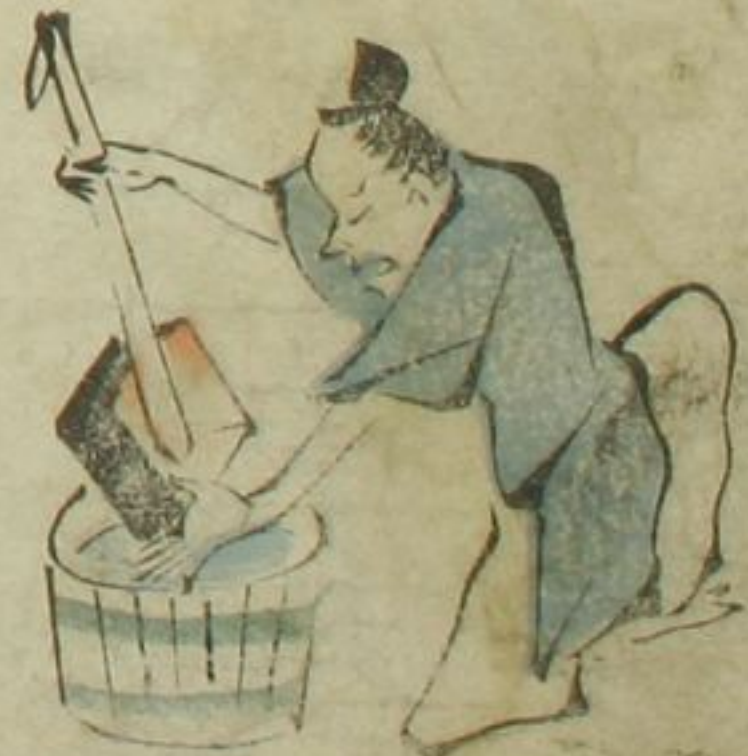
き り こ ら 重 拍 り