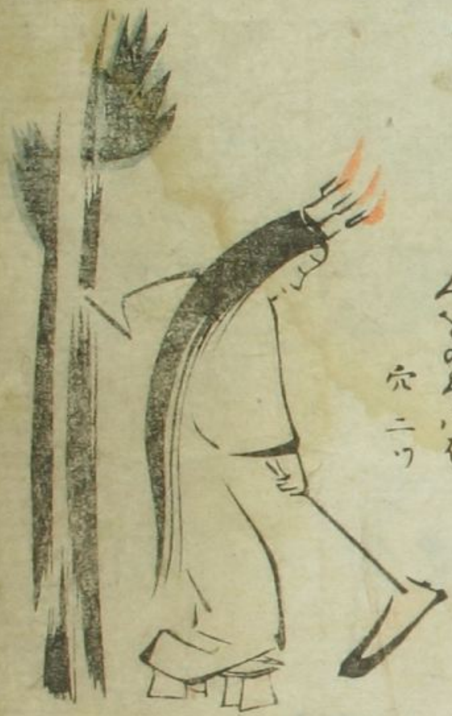
んまのらに 穴ニツ