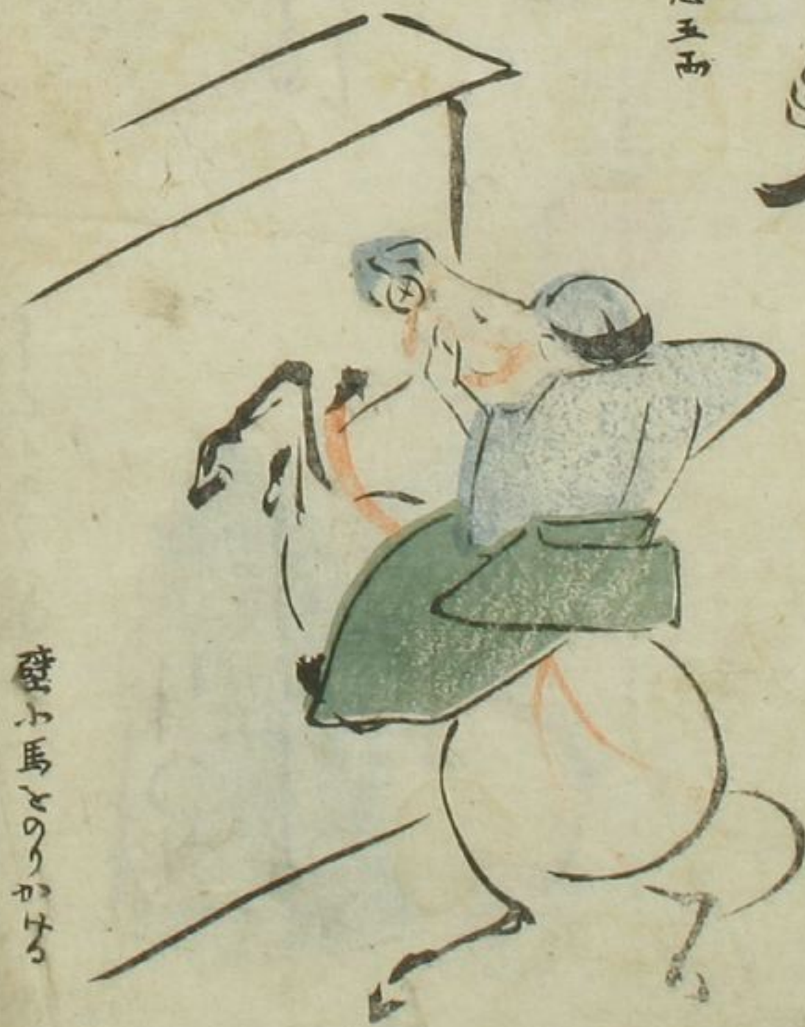
駿馬そのりかける