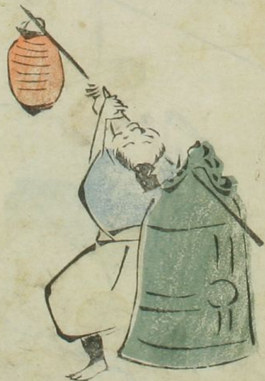
ちんちんちんちん