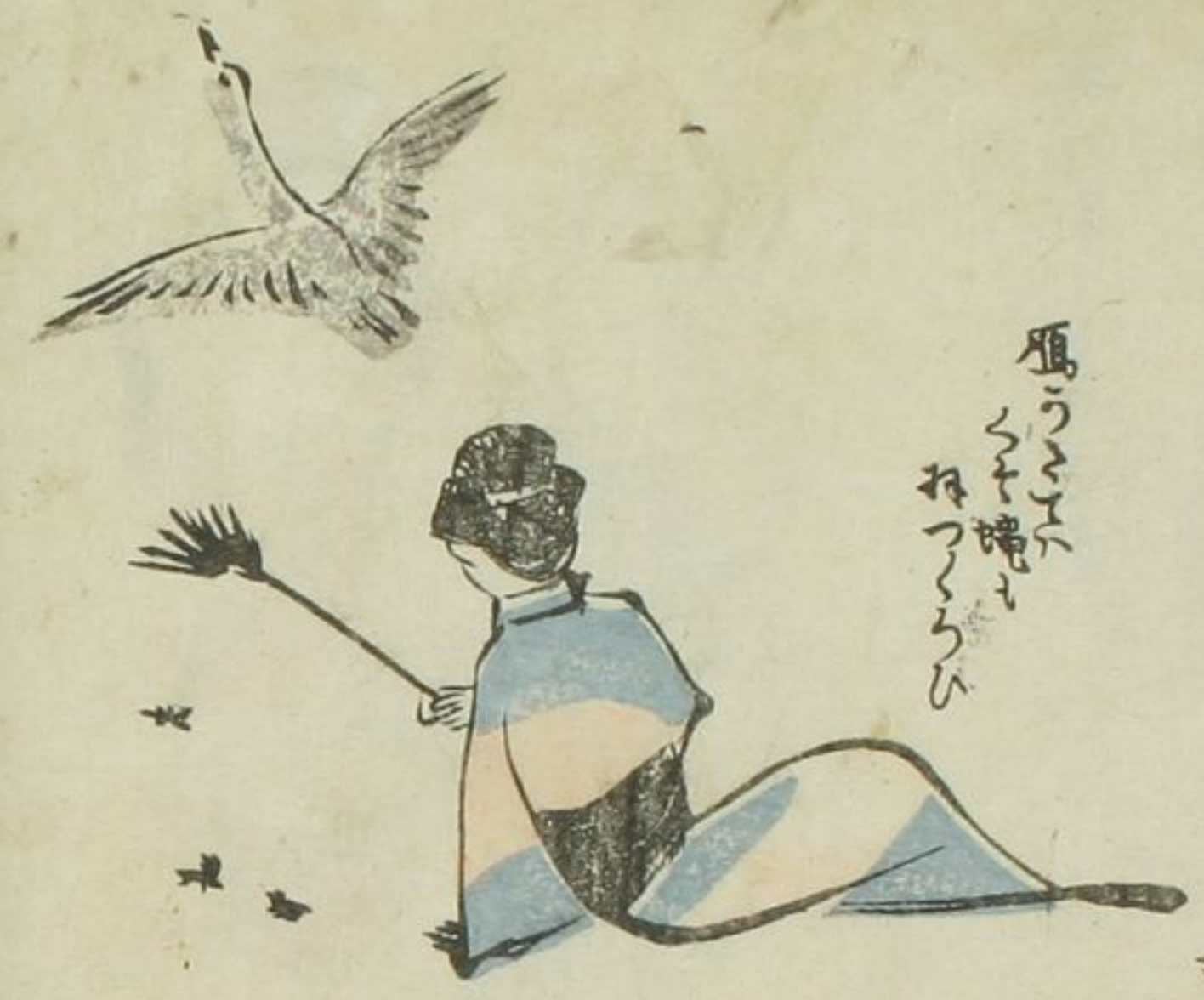
雁の鳴き くさくさ おつらう