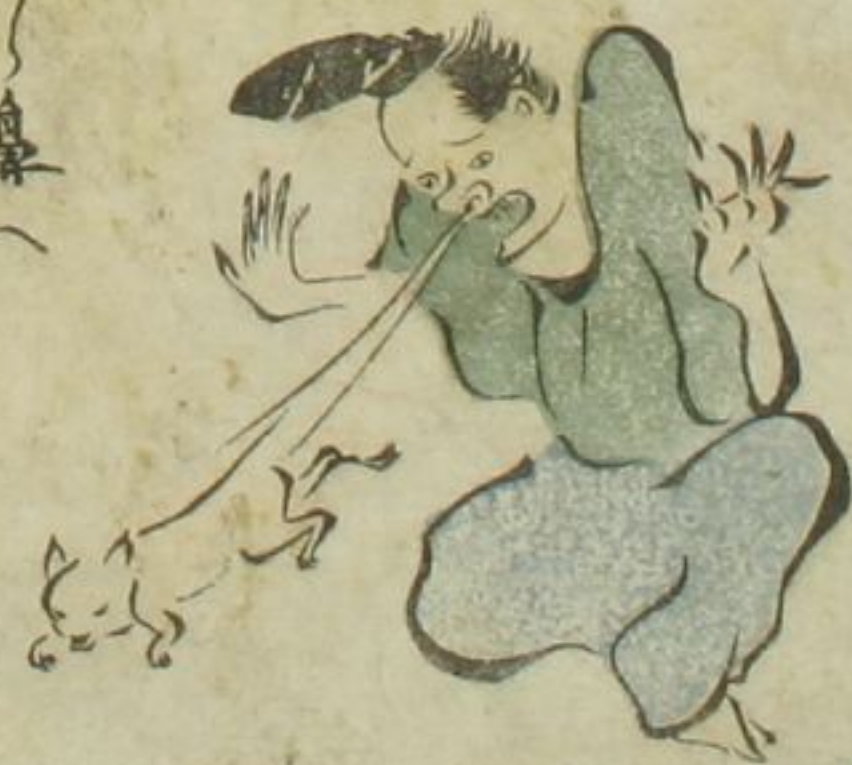
目 う 鼻 わ ら う