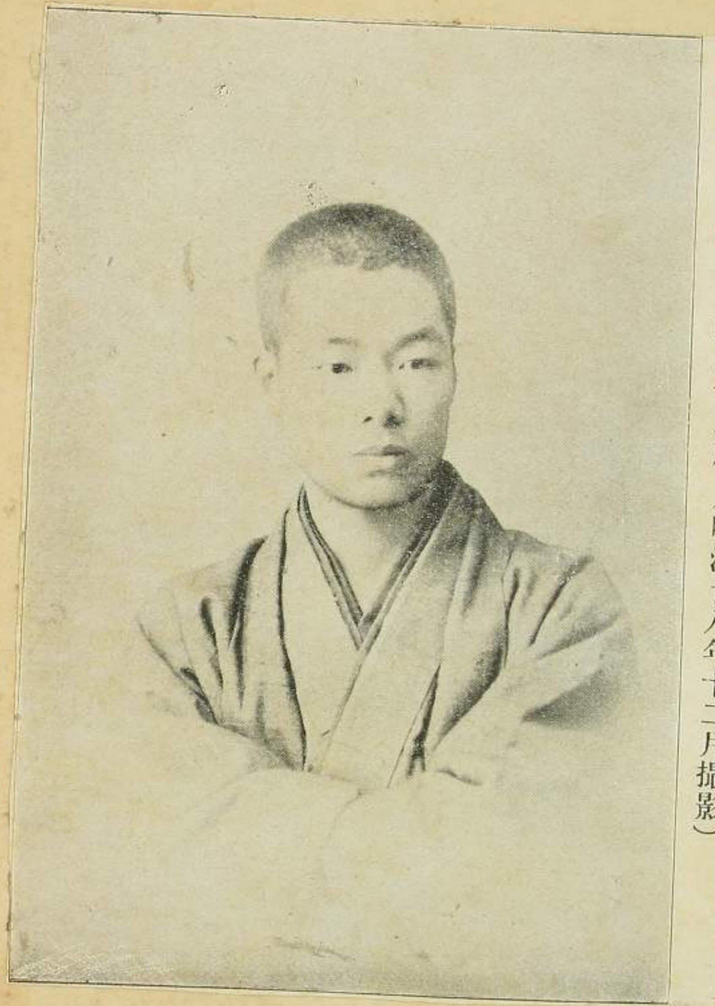
岩野泡鳴氏、歳二十三歳（明治廿八年十二月撮影）