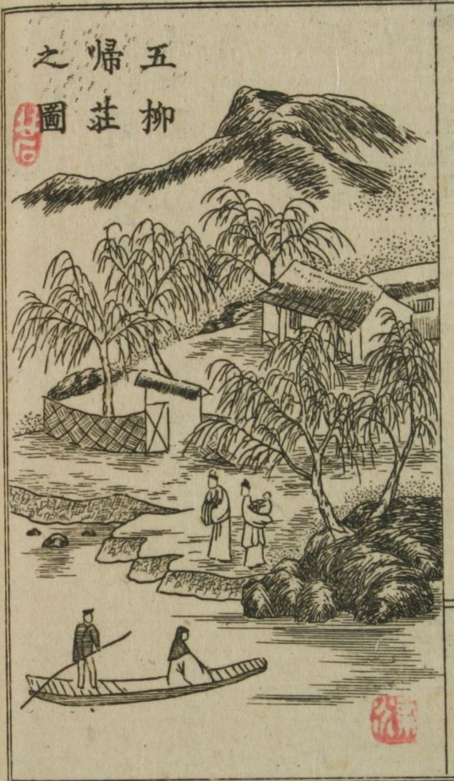
五柳 歸莊 之圖